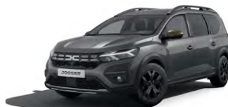
SIVÁ SCHISTE (2)