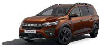
HNEDÁ TERRACOTTA (1)