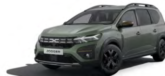
ZELENÁ DUSTY (2)