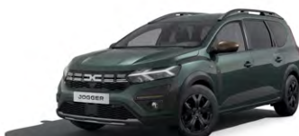
ZELENÁ CÈDRE (1)