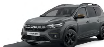
SIVÁ URBAN (2)