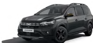
ČIERNÁ NACRÉ (1)