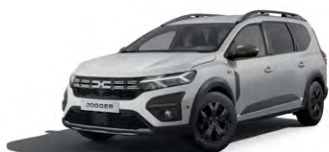
BIELA GLACIER (2)