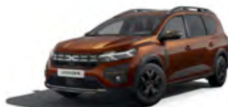
HNEDÁ TERRACOTTA (1)