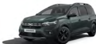
ZELENÁ CÈDRE (1)