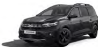
ČIERNÁ NACRÉ (1)