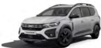
BIELA GLACIER (2)