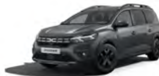
SIVÁ SCHISTE (2)