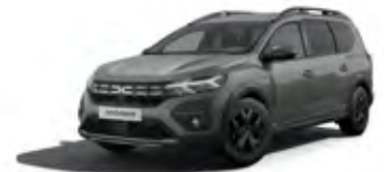
ZELENÁ DUSTY (2)