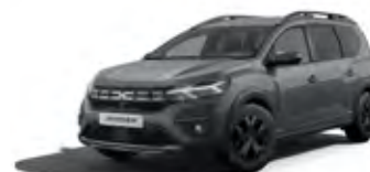
SIVÁ URBAN (2)