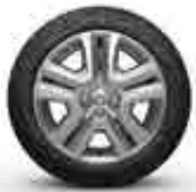
16" SARIA JANT KAPAĞI