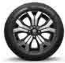
16" MAHALIA* JANT