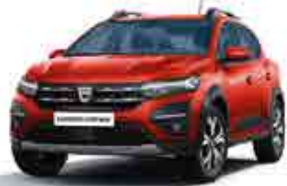
MERCAN KIRMIZI (2)