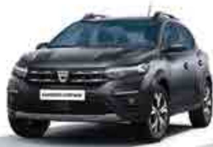
GRİ FÜME (2)