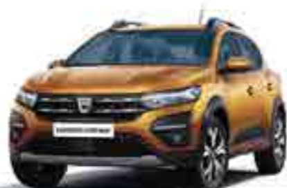
ATACAMA TURUNCU (2)