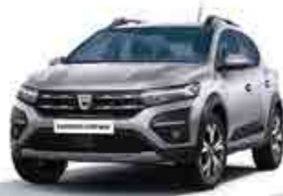
ARSENİK GRİ (2)