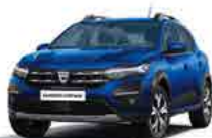
DEMİR MAVİ (2)