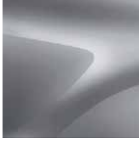
ANTRASİT GRİ (HQA)