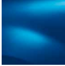
GÖK MAVİ (RPL)*