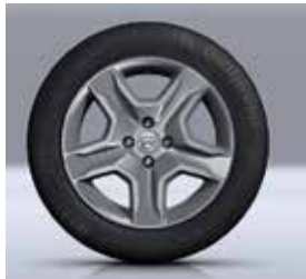
KOYU METAL 16" BAYADÈRE JANTLAR *

* Sadece Stepway versiyonda mevcuttur ** Stepway versiyonda mevcut değildir.