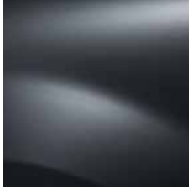
GRİ FÜME (KNA)