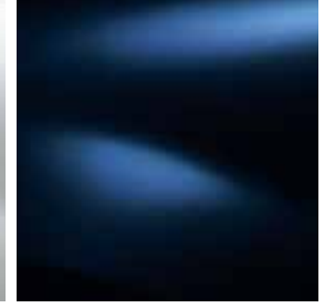
UZAY MAVİ (D42)**