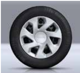
15" GROOMY JANT KAPAĞI**