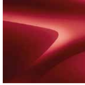
MERCAN KIRMIZI (NPI)