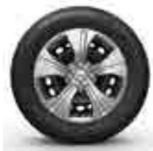
15" ELMA JANT KAPAĞI