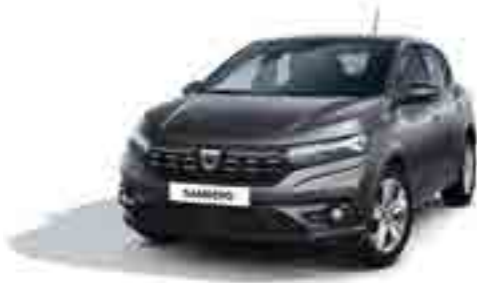
GRİ FÜME (2)