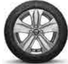
16" AMARIS JANT