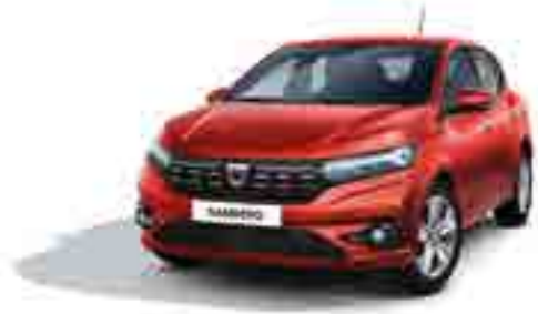
MERCAN KIRMIZI (2)