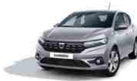
ARSENİK GRİ (2)