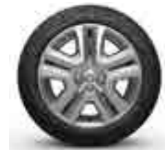
16" SARIA JANT KAPAĞI