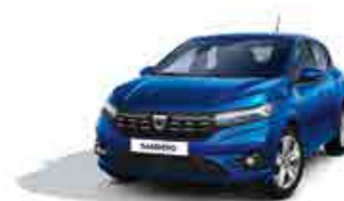
DEMİR MAVİ (2)