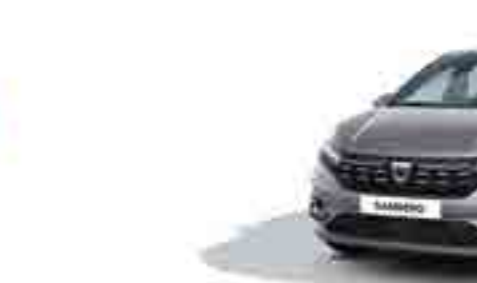
AYIŞIĞI GRİ (2)