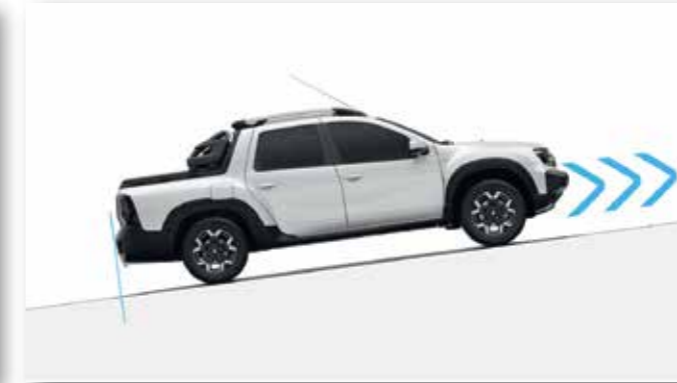
ASISTENTE DE ARRANQUE EN PENDIENTE (HSA)