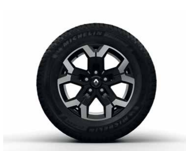
llanta de 16" de aleación diamantada