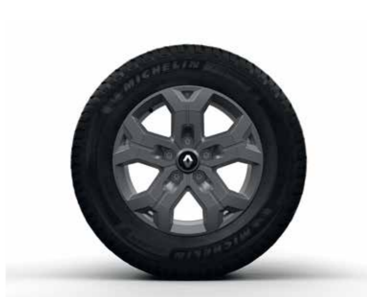
llanta de 16" de aleación