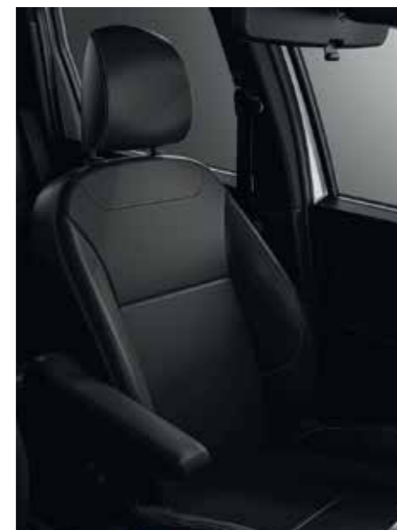
Iconic 1.3 TCe CVT / Outsider 1.3 TCe 4WD