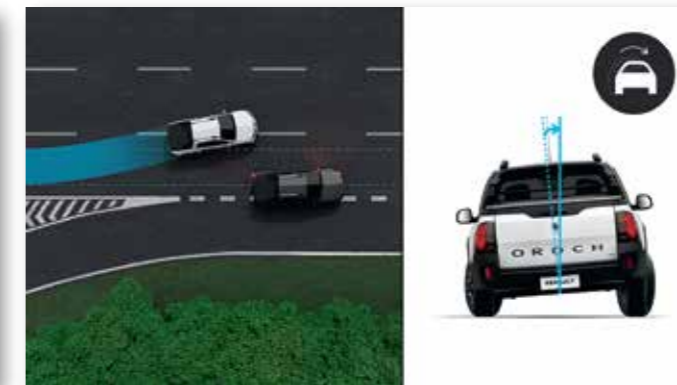
SISTEMA DE ROLLOVER (ROM)