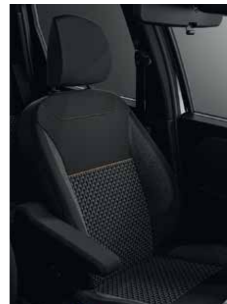
Emotion 1.6 Sce