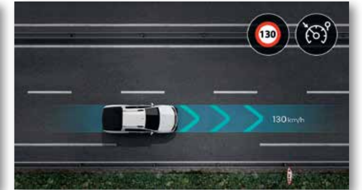
CONTROL DE VELOCIDAD CRUCERO