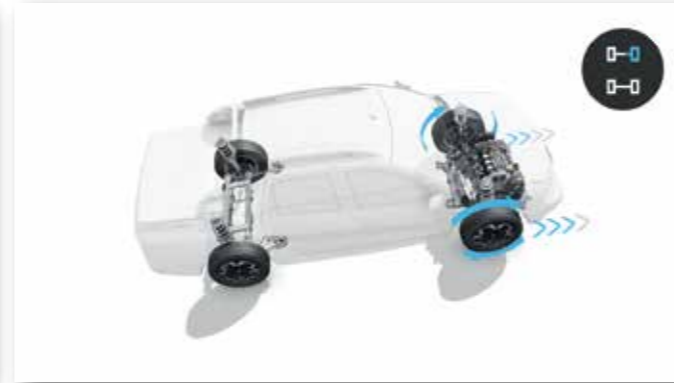
CONTROL DE TRACCIÓN (TCS)