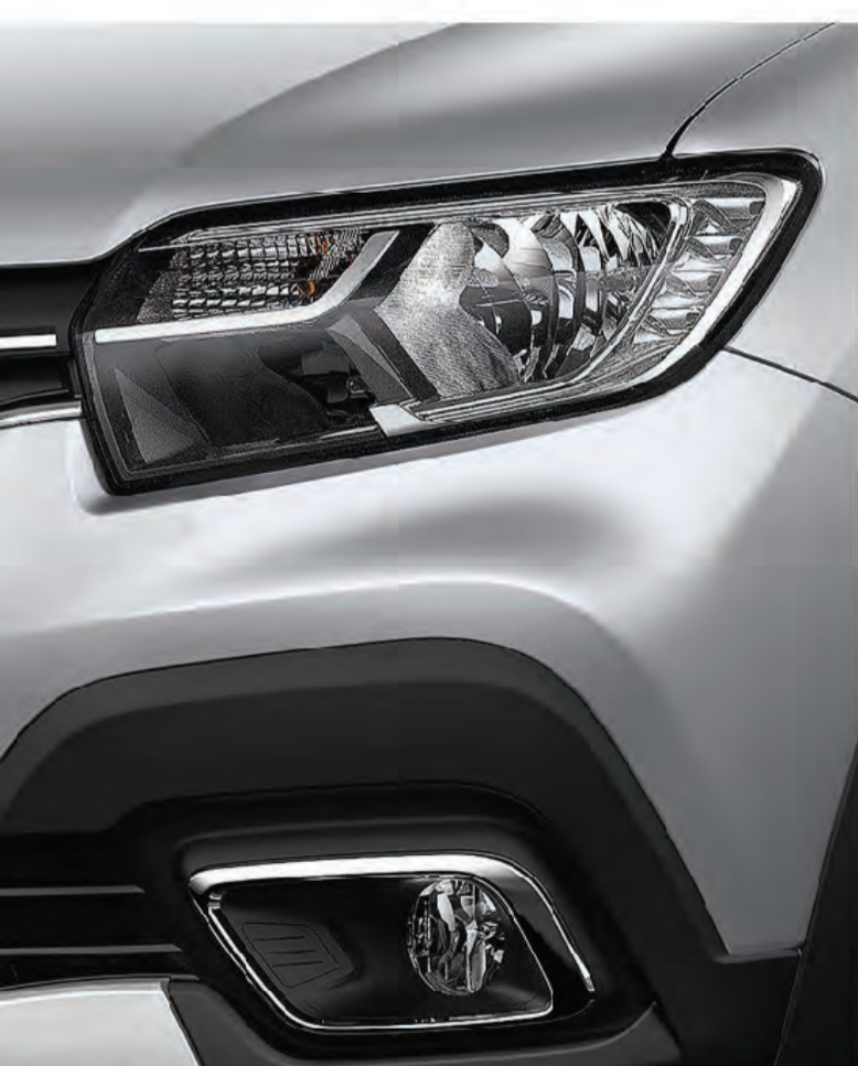
faros DRL LED en formato C-Shape característicos

los faros DRL LED en forma C-Shape hacen que manejar de noche sea más seguro