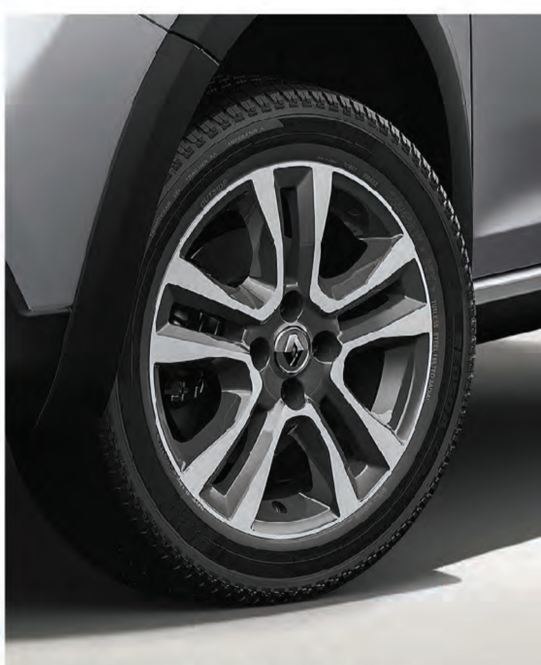
llantas diamantadas de 16"