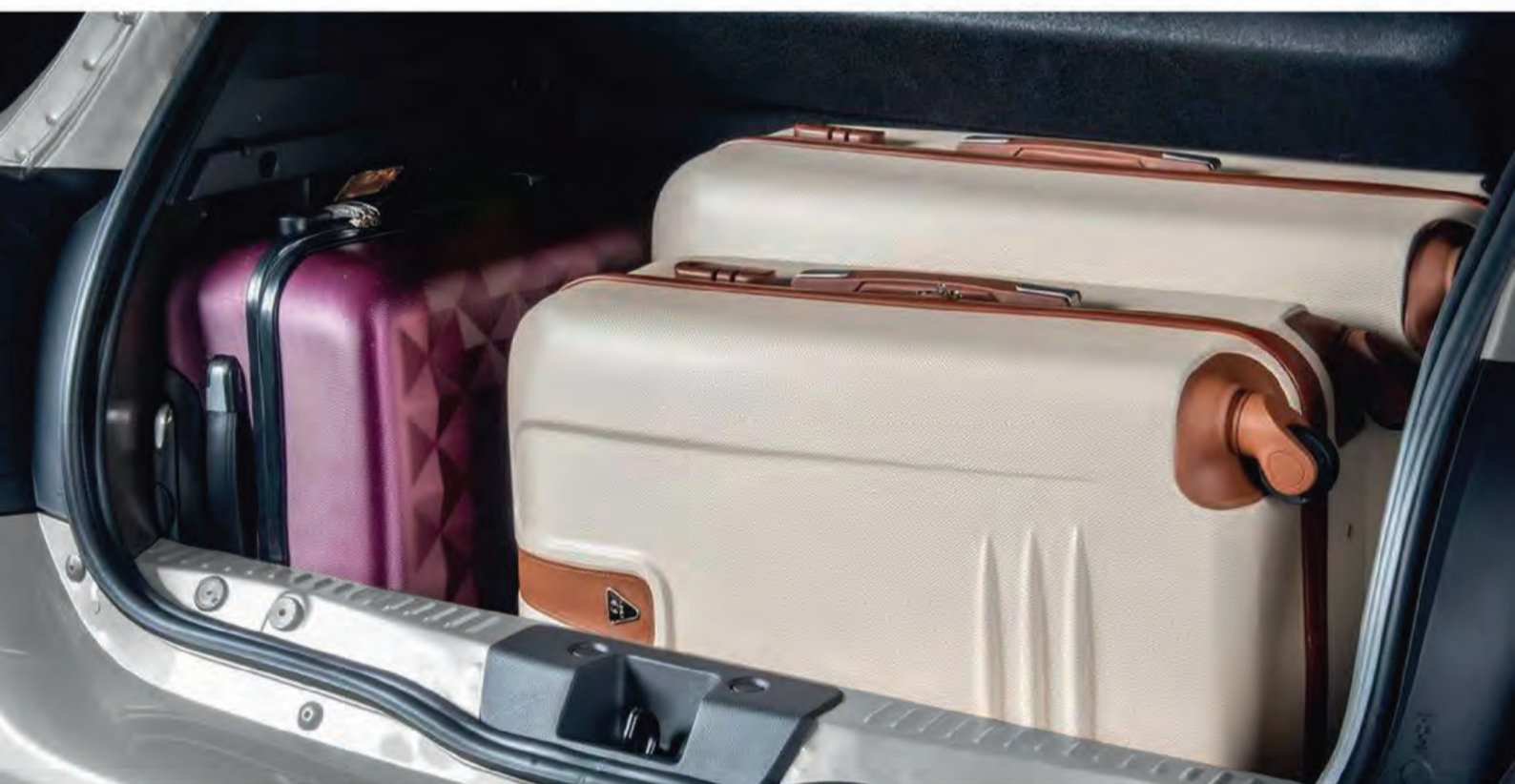
amplio baúl de hasta 320 litros

sus asientos traseros plegables implican que Renault Stepway puede llevar cualquier tipo de carga. si a eso sumamos espacios de almacenamiento pensados para toda la familia, Renault Stepway se convierte en un socio esencial para toda la vida