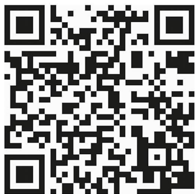
Código QR de WhistleB

Encontrará la lista de los miembros de la red en la intranet del Grupo Renault, al final de la página de inicio, en la sección "Enlaces útiles" "Ética y Cumplimiento" "¿Quiénes somos?".