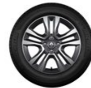
rodas de liga leve Jogger 16" biton diamantadas