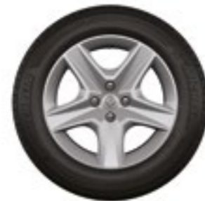
rodas Flex Wheel Oasis 16"