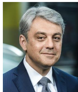
Luca DE MEO Diretor Executivo - CEO