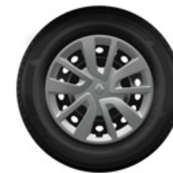
calotas Magiceo 15"