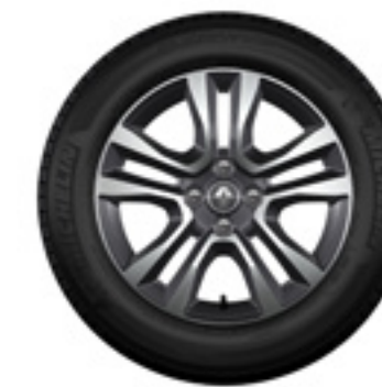
rodas de liga leve Jogger 16" biton diamantadas