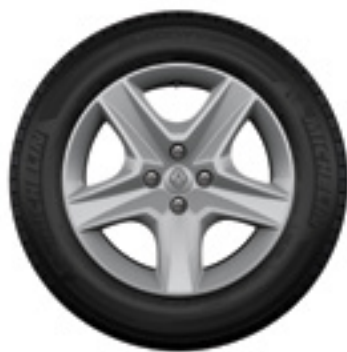
rodas Flex Wheel Oasis 16"