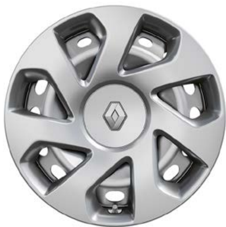
15" em aço

*Calotas vendidas separadamente como acessório.