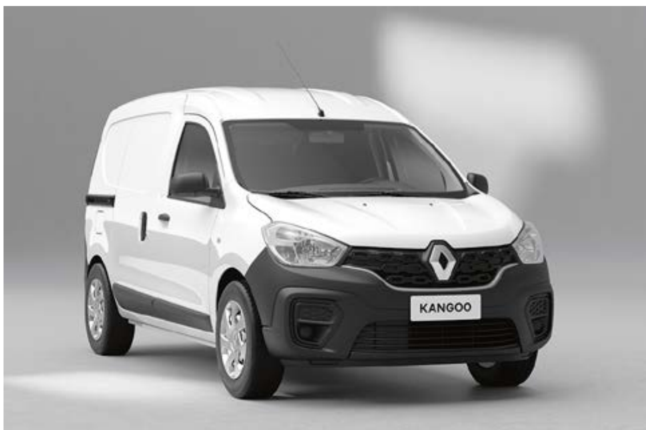
branco glacier (ps)