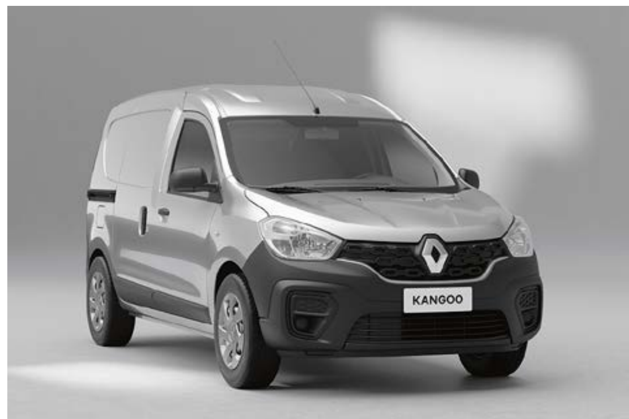
prata étoile (pm)

ps: pintura sólida pm: pintura metálica fotos não vinculativas contratualmente