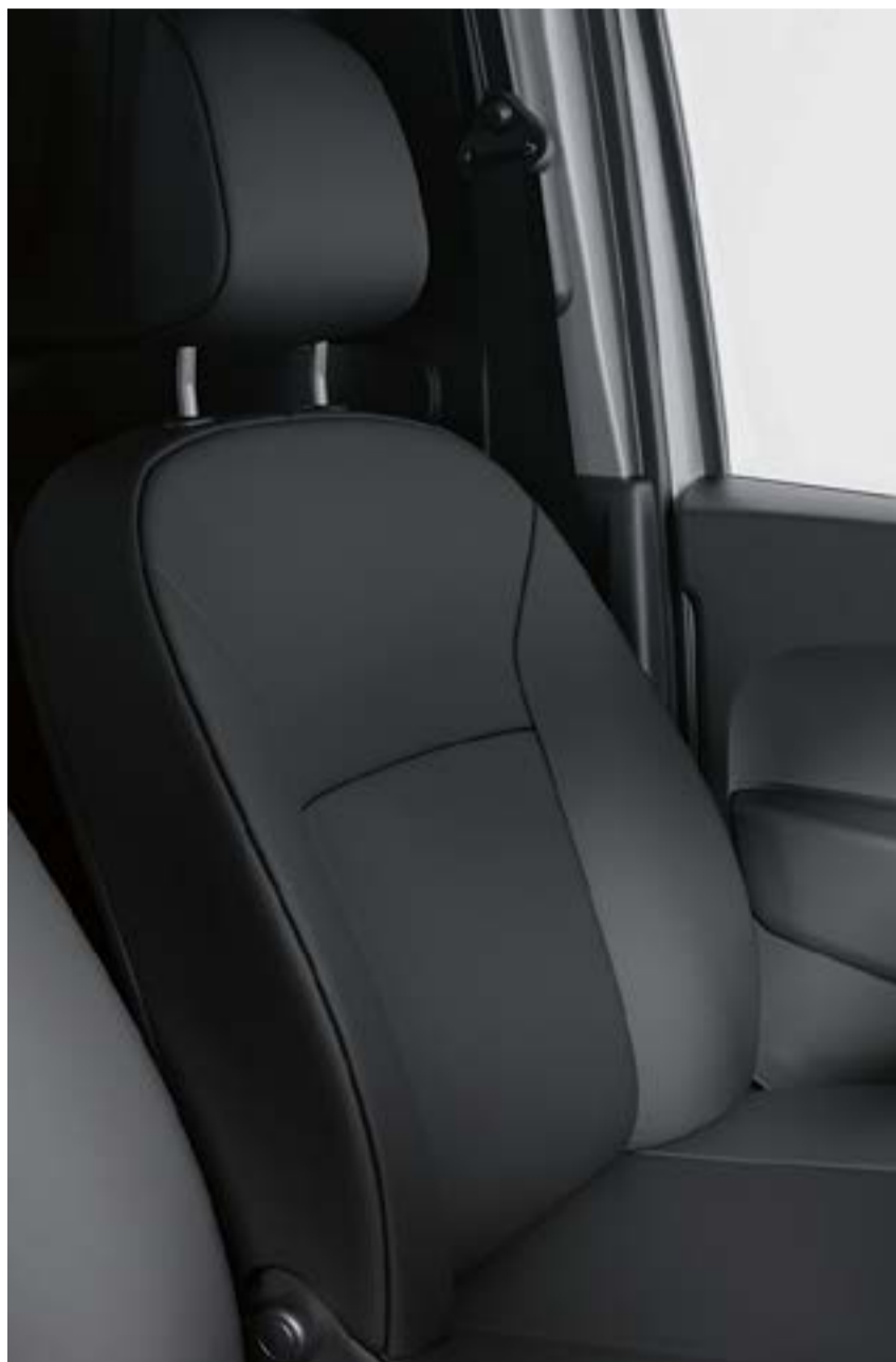
bancos com revestimento em tecido (preto java)