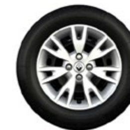
rodas Flex Wheel Oasis 16"