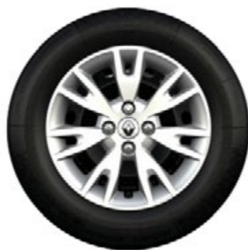
Calotas Eptius 15"