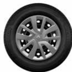
Calotas Magiceo 15"