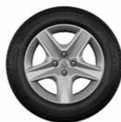
Rodas Flex Wheel Oasis 16"