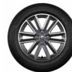
Rodas de liga leve Altica 16" biton diamantadas