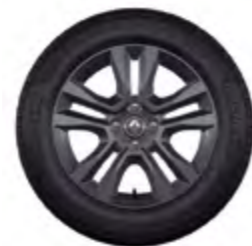
Rodas de liga leve Jogger 16"