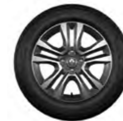
Rodas de liga leve Jogger 16" biton diamantadas