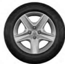
Rodas Flex Wheel Oasis 16"