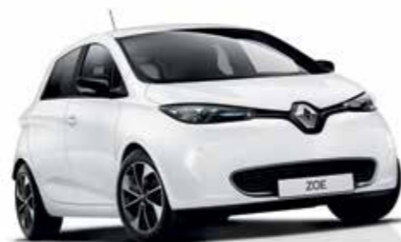
QNC - Branco Nacré