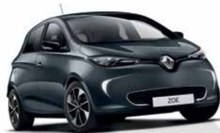
KNP - Cinza Titanium