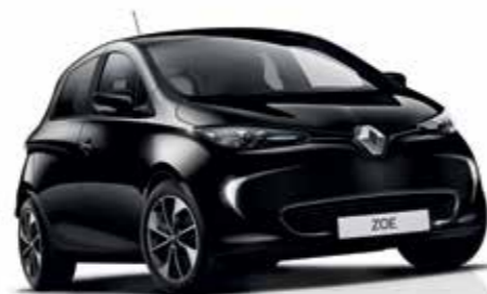
GNE - Preto Étoile