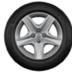
Rodas Flex Wheel Oasis 16"