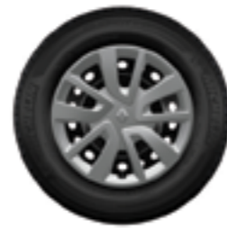
Calotas Magiceo 15"