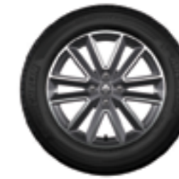
Rodas de liga leve Altica 16" biton diamantadas