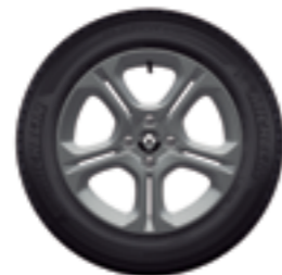
Rodas de liga leve 16" (opc. 1.0 | série 1.6 CVT)