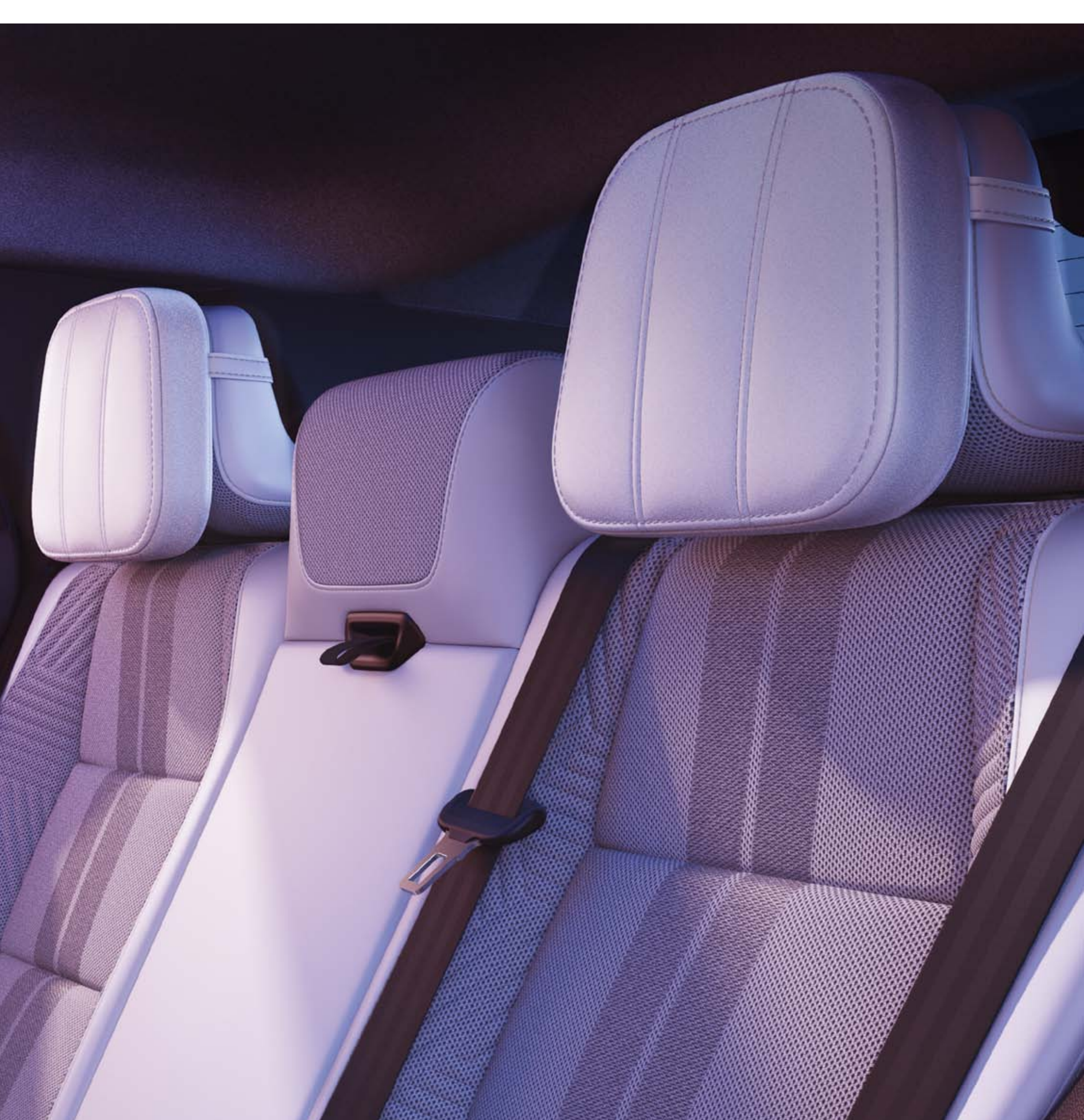
coussins grand confort sur appuis-tête arrière

Optimisez l'espace et le confort de vos passagers avec notre gamme d'accessoires. Les coussins grand confort sur appuis-tête arrière ajoutent une touche de design tout en offrant maintien et bien-être.