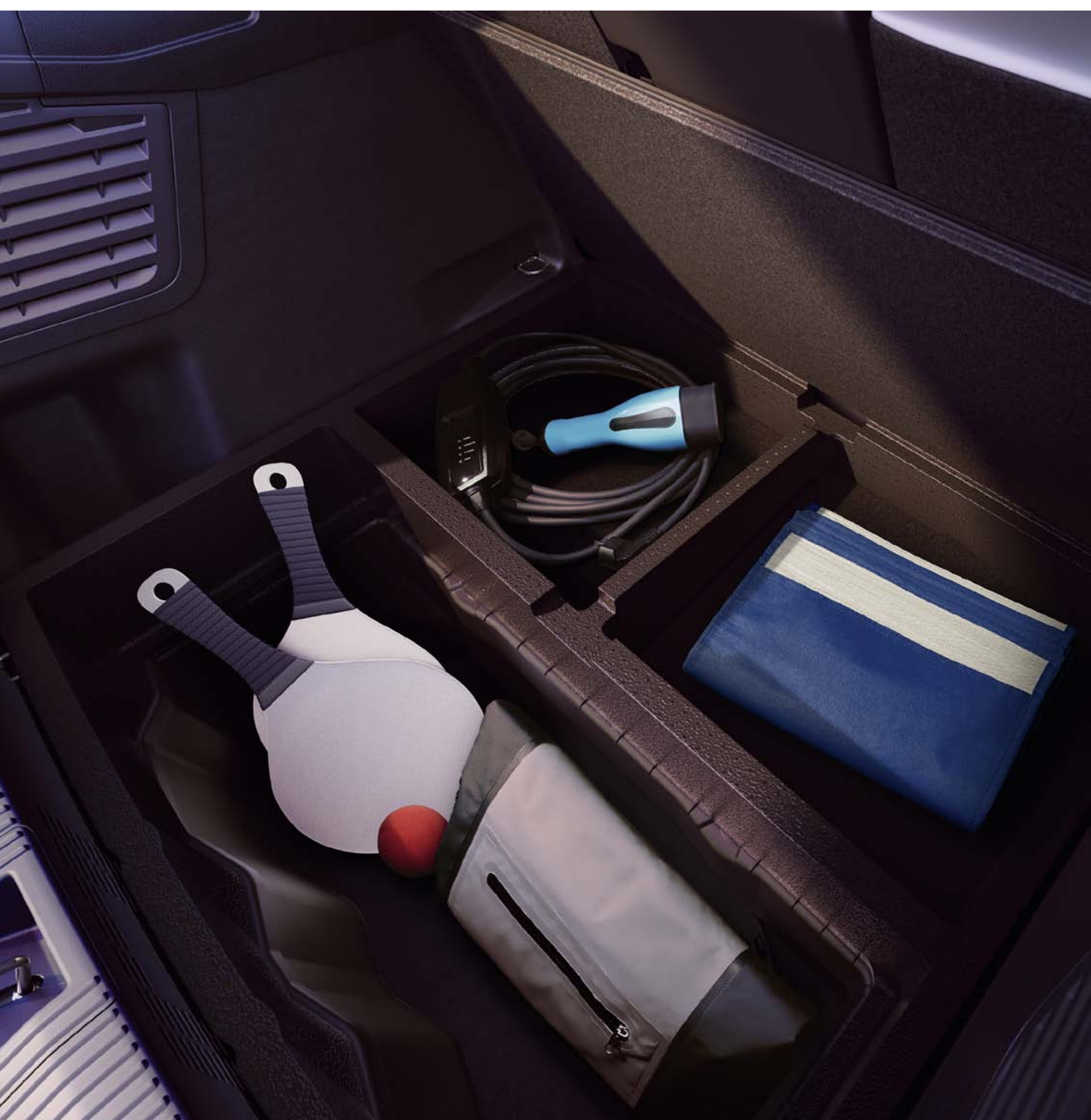
double plancher de rangement de câbles

Double plancher, double avantage: sans modifier le volume de rangement d'origine, le plancher du coffre se trouve rehaussé; l'accessibilité est facilitée et les compartiments permettent un rangement optimisé.