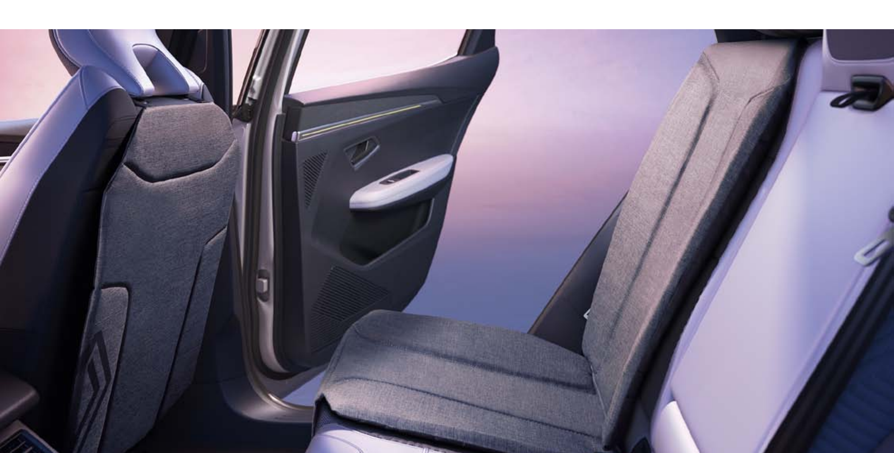
protections arrière pour siège auto

Grâce à cette protection en deux parties, préservez des traces et des salissures le dossier du siège avant ainsi que la partie de la banquette arrière située sous le siège enfant.