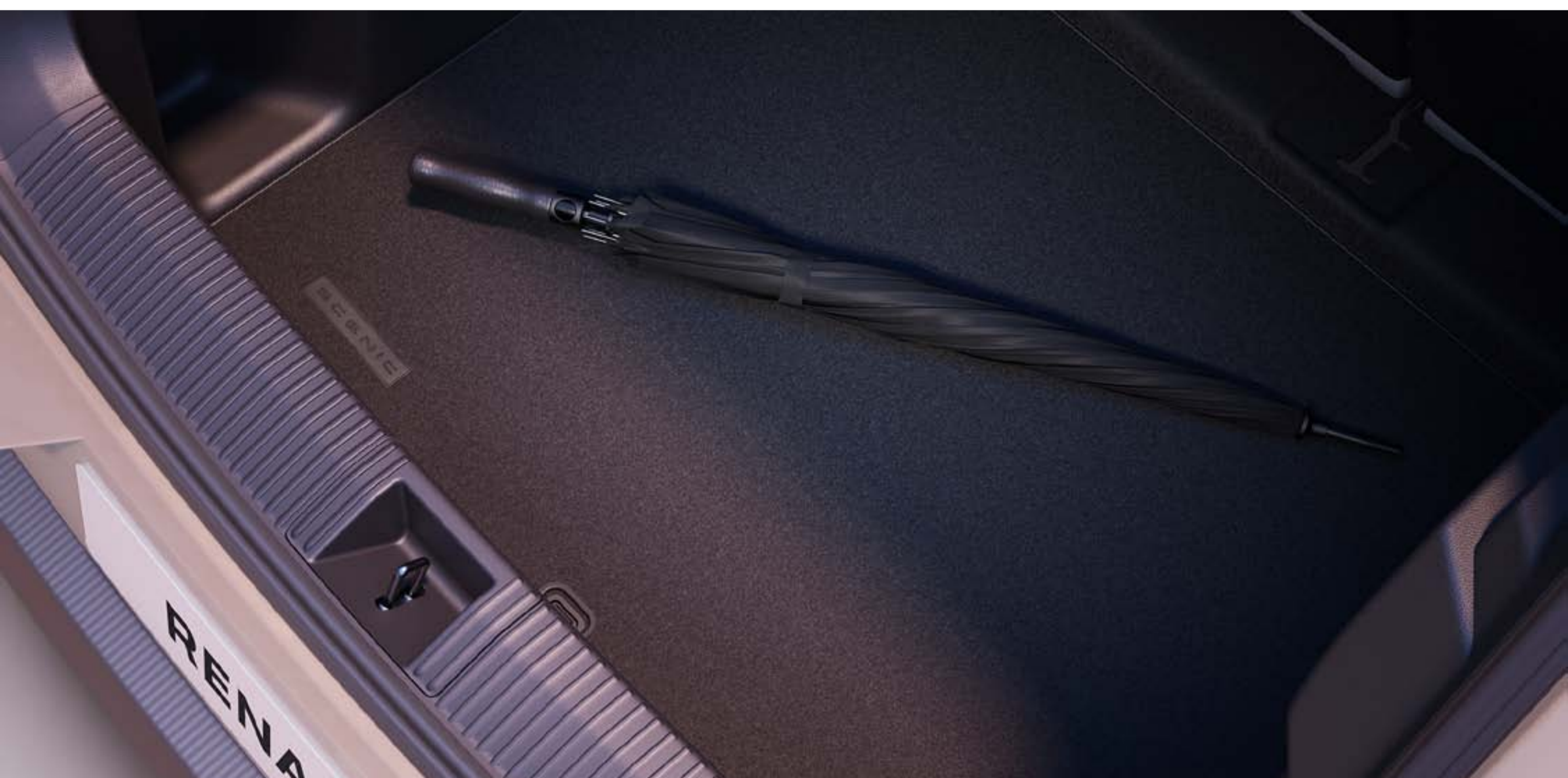
tapis de coffre premium

Protégez votre revêtement de coffre avec ce tapis premium et chargez en toute tranquillité bagages ou marchandises.