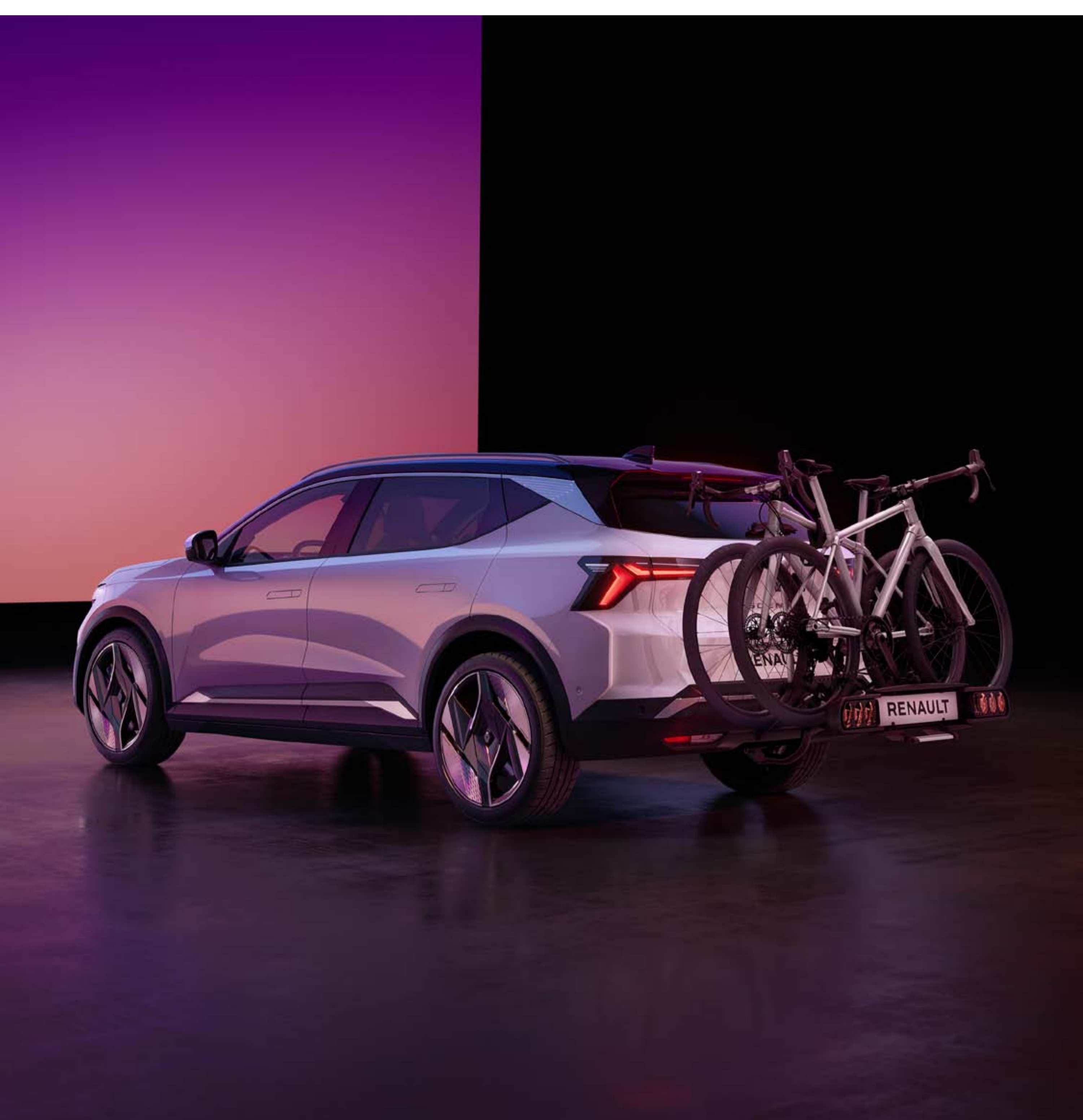
pack attelage démontable sans outil et porte-vélo pour 2 vélos sur attelage

Équipé d'un attelage, Renault Scenic E-Tech 100% electric tracte jusqu'à 1.1t en remorquage, et transporte facilement un porte-vélo (75 kg de charge verticale).