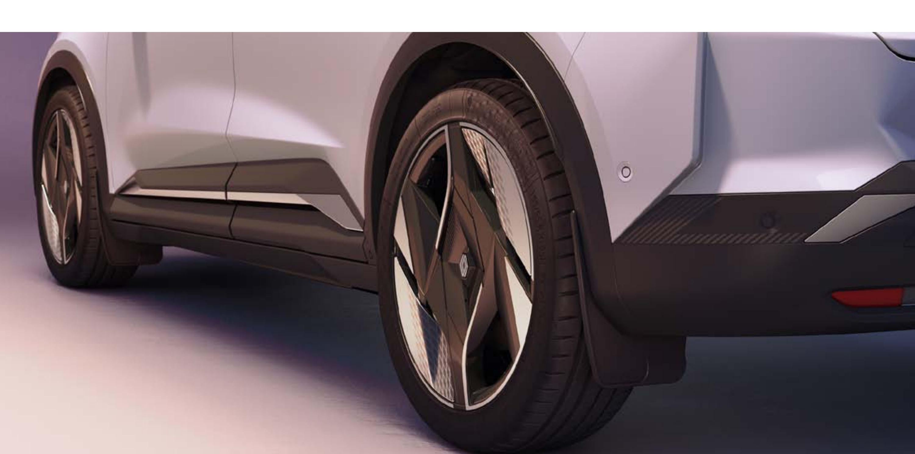
bavettes de protection

Les bavettes Renault préservent les bas de caisse et les roues des projections d'eau, de boue et de gravillons.