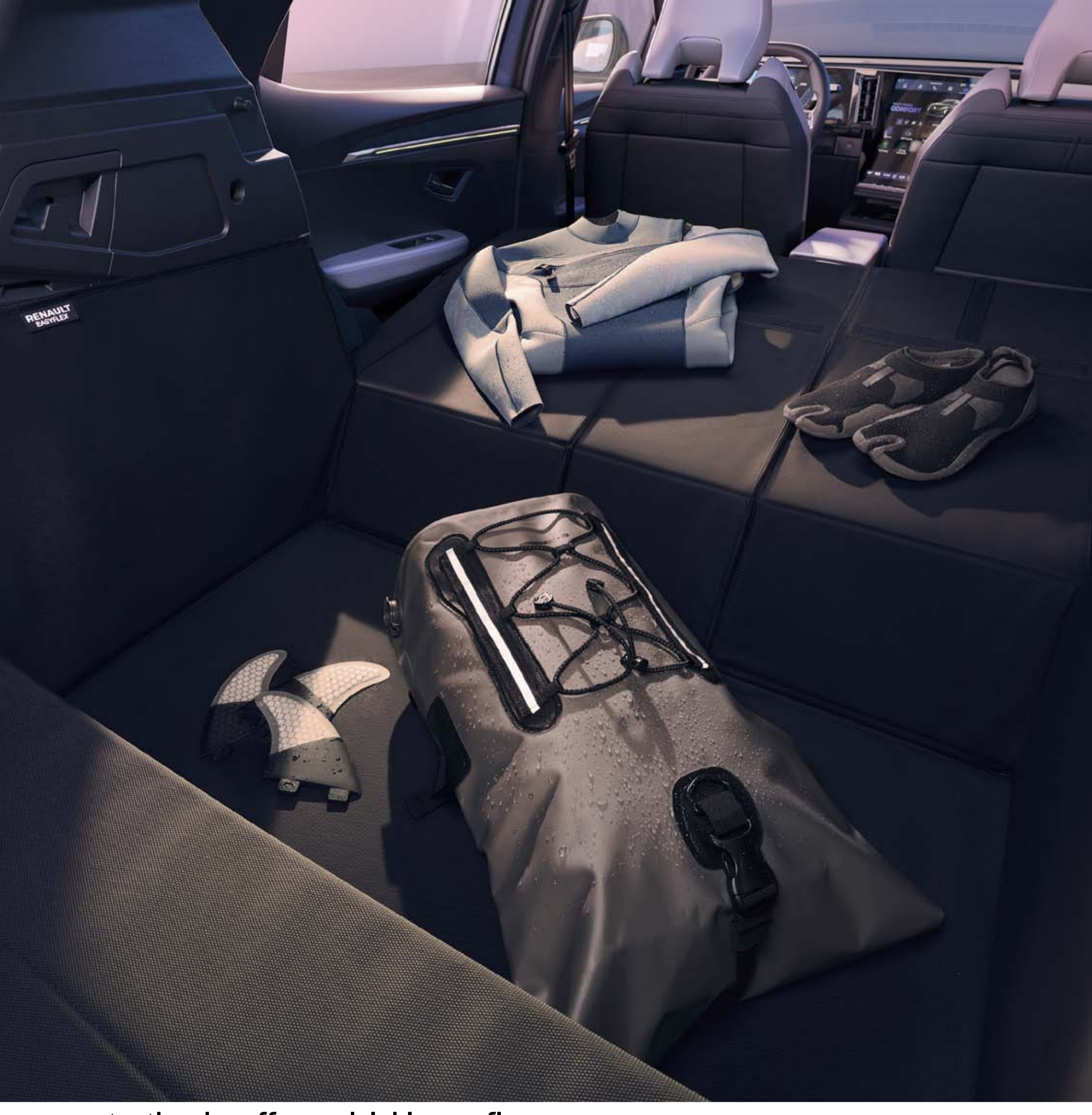
protection de coffre modulable easyflex

L'intérieur de votre véhicule est préservé de l'usure et des salissures grâce à la gamme de surtapis sur mesure et personnalisés. Antidérapante et imperméable, la protection de coffre modulable easyflex couvre toute la surface du coffre et permet de transporter des objets salissants. Dépliée, elle s'adapte aux différentes positions de la banquette arrière.