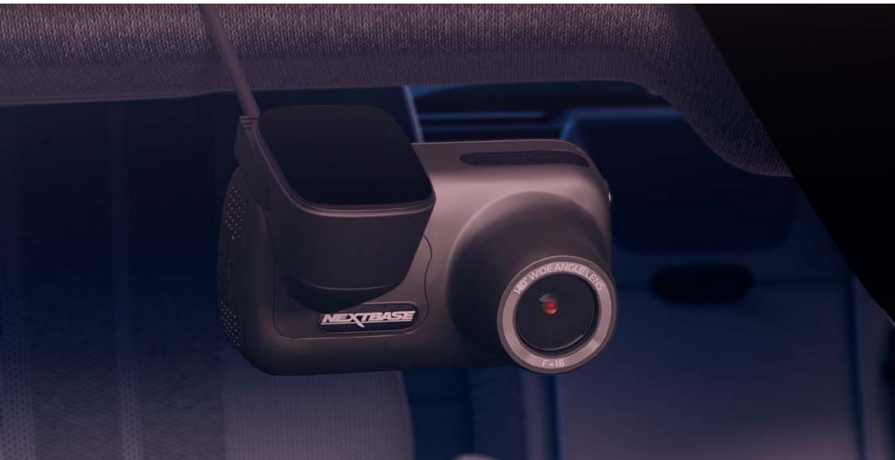
caméra embarquée dashcam

L'historique de vos parcours est conservé grâce à la caméra embarquée dashcam, apportant le meilleur témoignage si nécessaire.