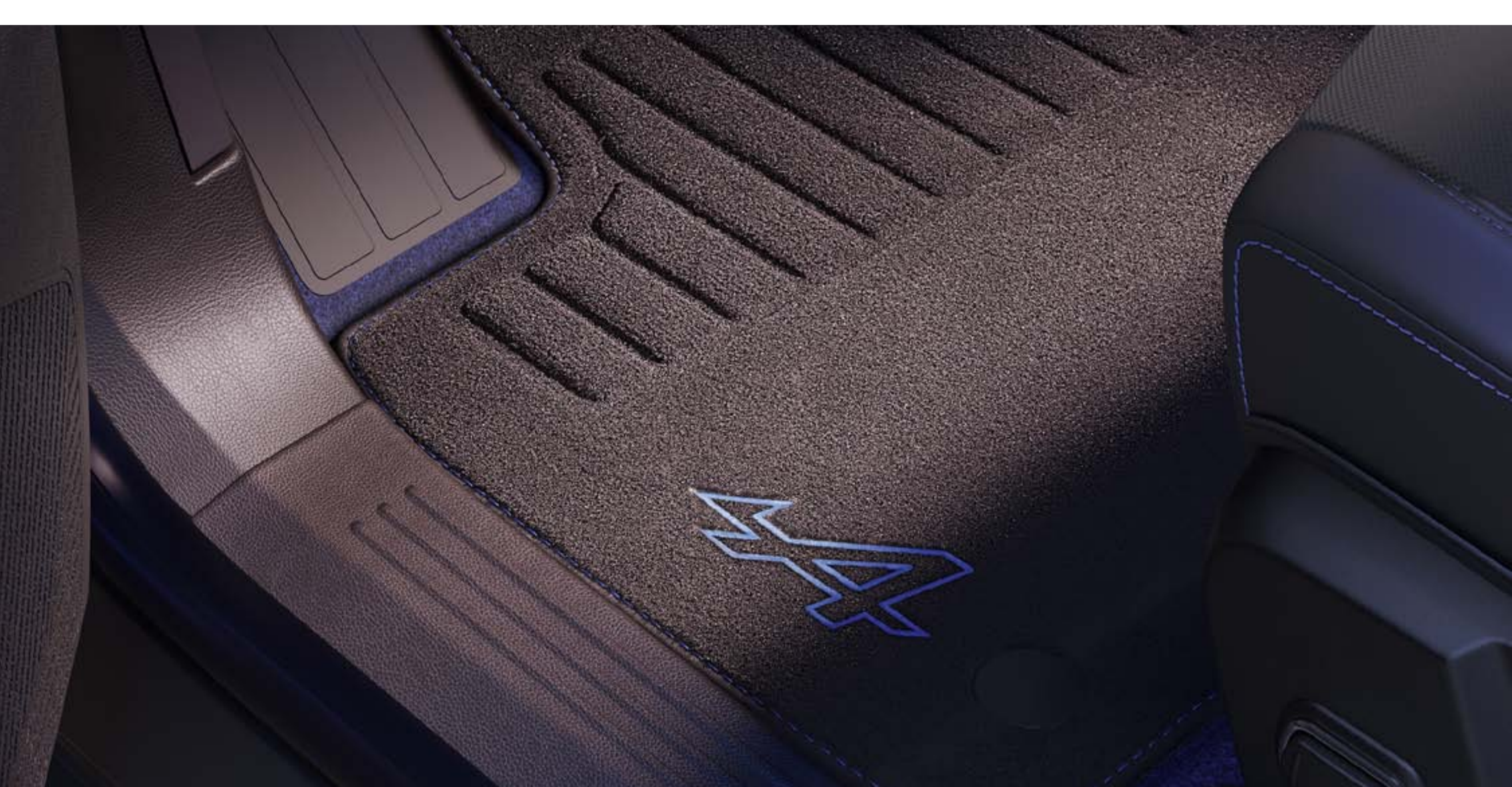
surtapis esprit Alpine

L'esprit Alpine souffle dans l'habitacle avec les surtapis premium brodés du célèbre « A », soulignant le caractère sportif de Renault Scenic E-Tech 100% electric.