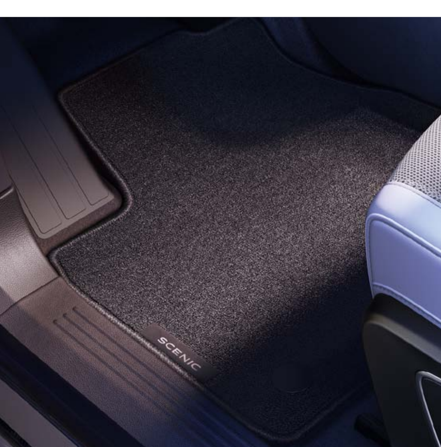
surtapis textile confort

Assurez une protection optimale de votre habitacle avec ces surtapis textile ultra robustes ou ces surtapis caoutchouc étanches à bords hauts.