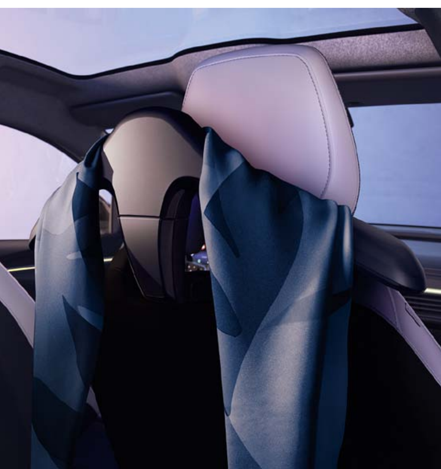
cintre sur système d'appuis-tête multifonction

Le temps du trajet, retirez votre veste et posez-la sur le cintre fixé au dos de votre siège. Amovible, il peut aussi être remplacé par un crochet porte-sac ou une tablette aviation pour poser un livre, un smartphone ou une gourde.