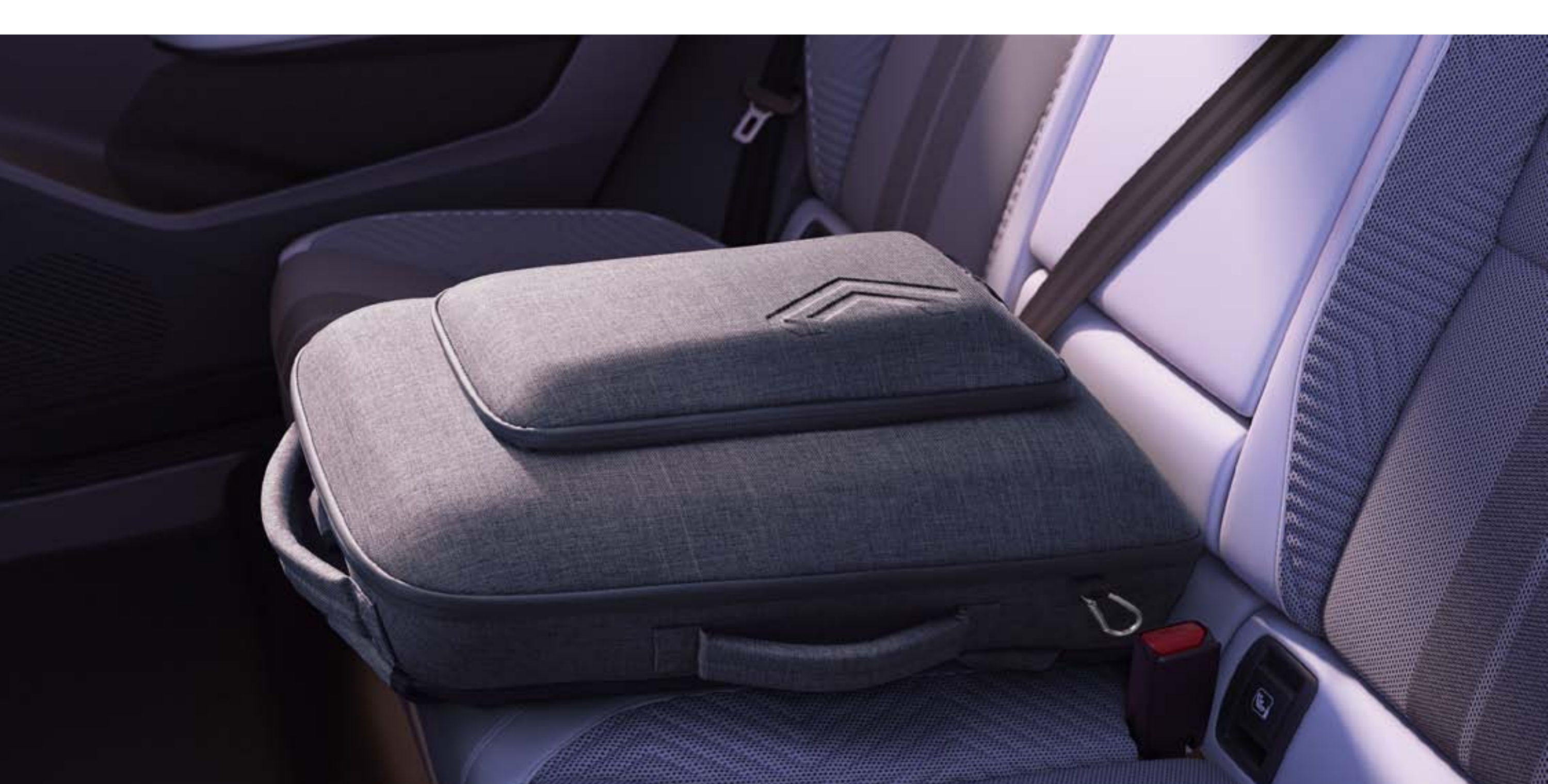
accoudoir arrière nomade, également rangement et sac à dos

Pensé pour les passagers arrière, l'accoudoir offre un espace de rangement fermé supplémentaire. Multifonction, il se transforme en sac à dos pour emporter les indispensables de la famille.