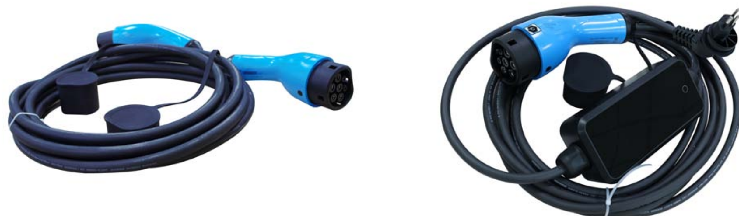
câble pour wallbox et câble pour prise domestique

Rechargez facilement votre véhicule électrique et maîtrisez votre autonomie. Tout se fait rapidement et en toute sécurité. Optez pour le câble de recharge type 2 pour wallbox qui s'utilise sur les bornes de recharge publiques et les bornes de recharge domestiques. De manière occasionnelle, utilisez le câble domestique adapté aux prises standards.