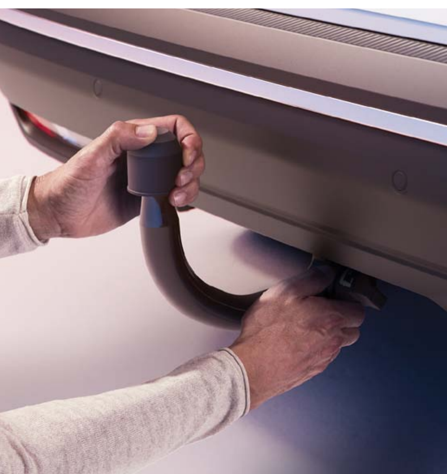
attelage démontable sans outil

Très facile à utiliser, l'attelage démontable sans outil préserve l'esthétique de votre véhicule: une fois la rotule enlevée, l'attelage est quasi invisible.