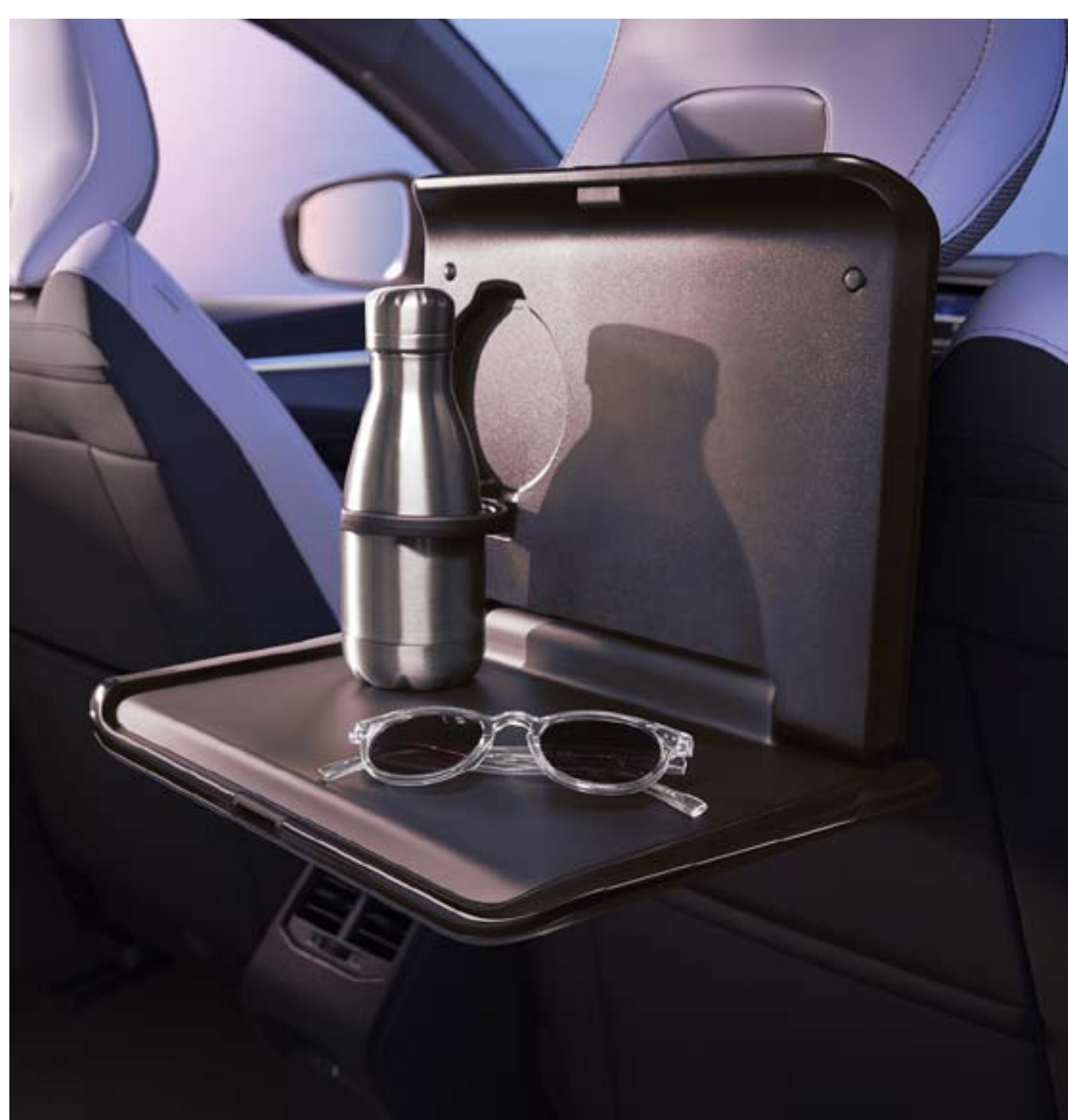
tablette arrière sur système d'appuis-tête multifonction