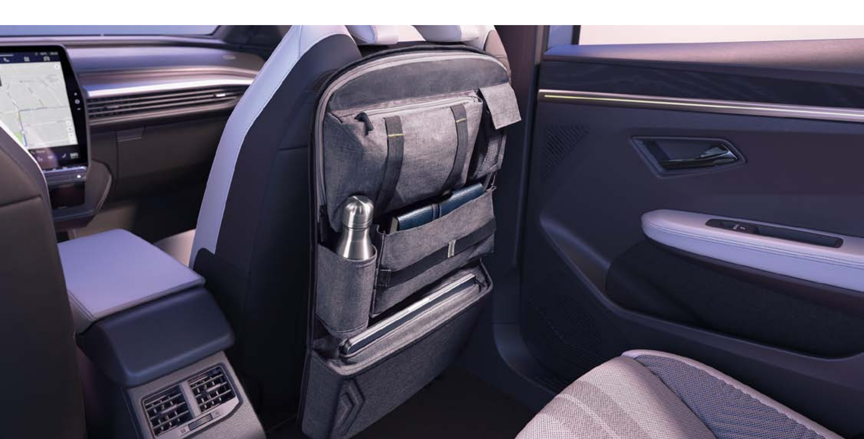
organisateur multifonction sur siège avant

Fixé au dos du siège avant, l'organisateur multifonction a six compartiments de tailles différentes pour y glisser facilement divers objets et dispose d'un espace dédié pour accueillir une tablette numérique.