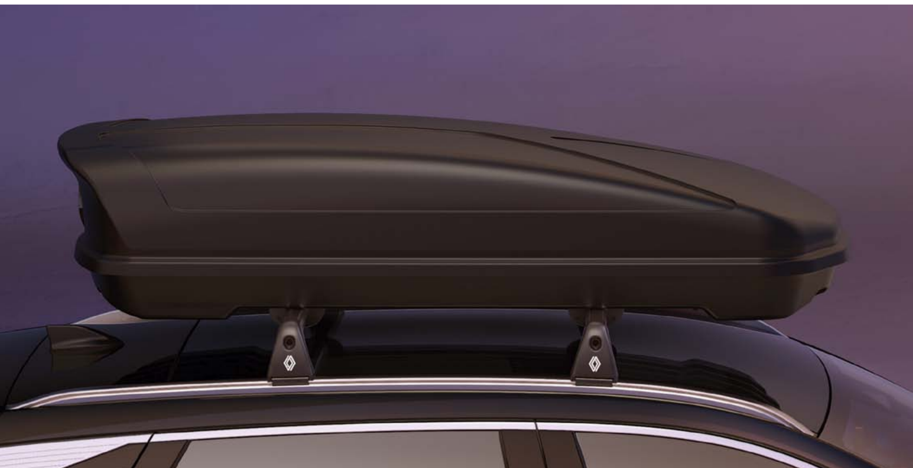
coffre de toit Renault 480 litres sur barres de toit

Les barres de toit permettent de fixer au choix porte-vélo, porte-skis ou coffre de toit. Compatibles avec le toit panoramique, elles s'installent facilement et sans outil.