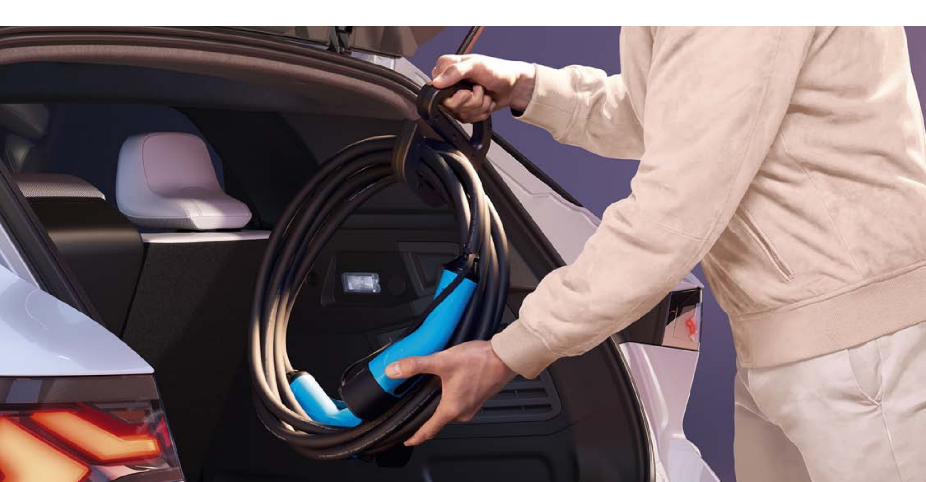
poignée porte-câble de recharge

Sortez, rangez vos câbles de recharge sans effort avec cette poignée porte-câble discrète et pratique. Sa dragonne vous permet de suspendre le câble lors de la recharge par exemple.