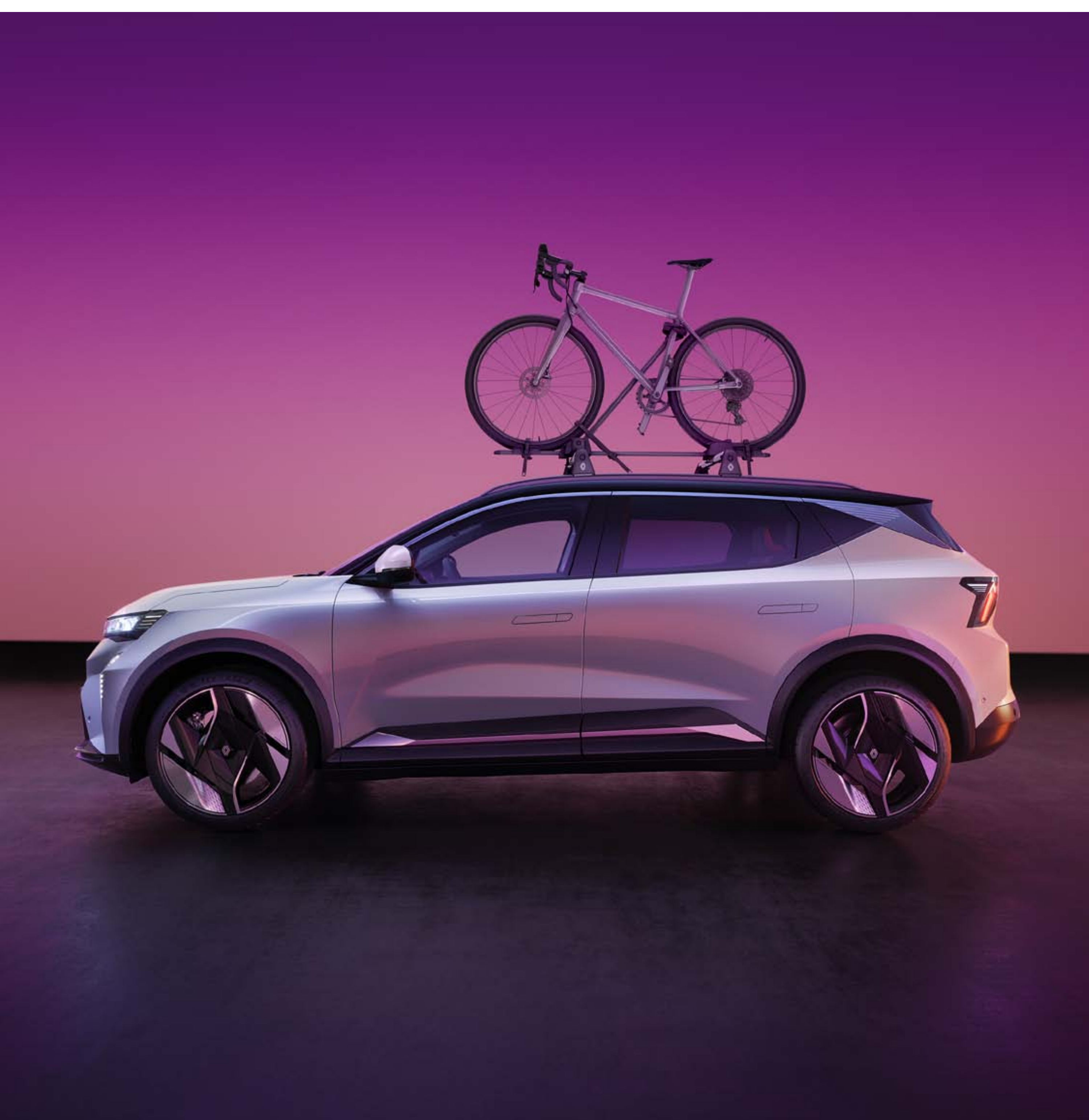
porte-vélo sur barres de toit

Des moments sportifs en famille, une envie de balade ou de découverte, transportez facilement et de façon sécurisée un vélo fixé sur le toit.