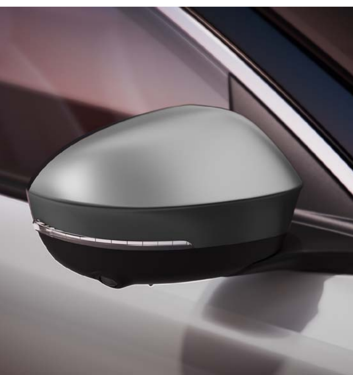
gris métal satin