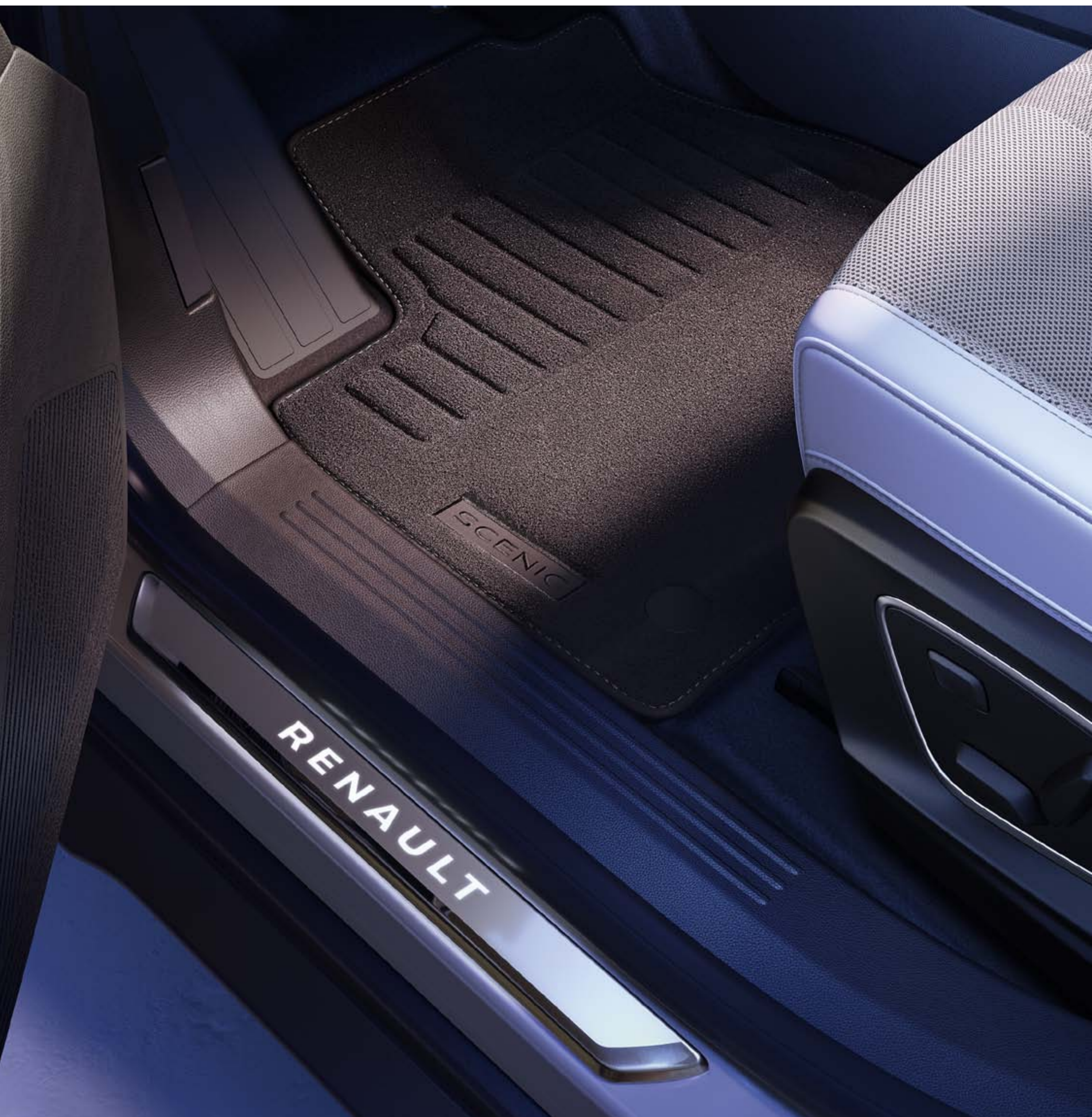
surtapis textile premium et seuils de porte éclairés Renault

Faites rimer protection et finition en installant des seuils de porte éclairés en aluminium brossé signés Renault et des surtapis textile premium.