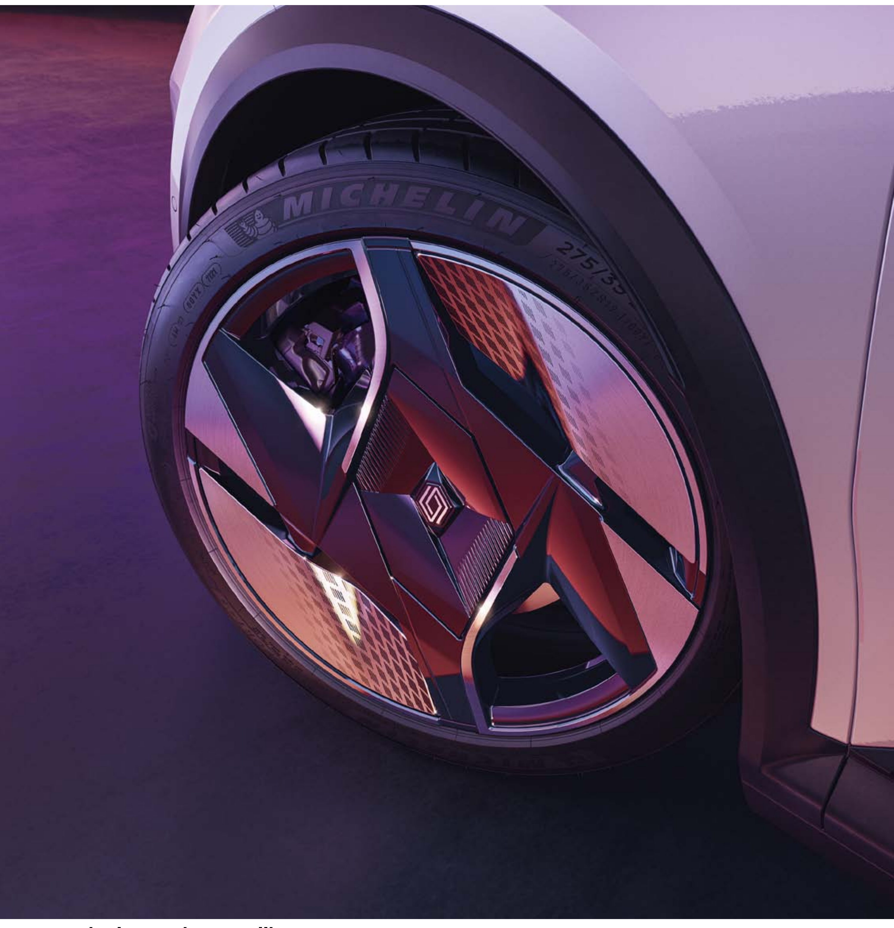
antivols pour jantes alliage

Les antivols pour jante assureront votre tranquillité en dissuadant les tentatives de vol des jantes ou des roues.