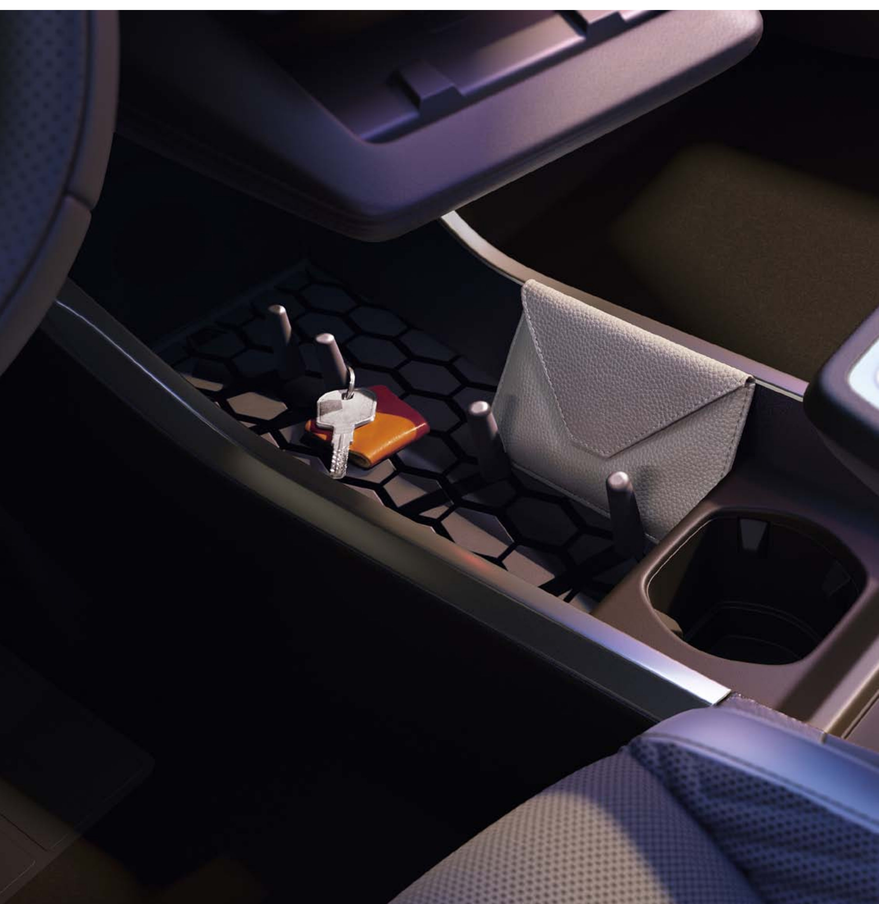
organisateur modulable de console centrale

Malin et innovant, l'organisateur de console centrale est modulable grâce aux picots positionnables librement pour garder tout ce dont vous avez besoin à portée de main.