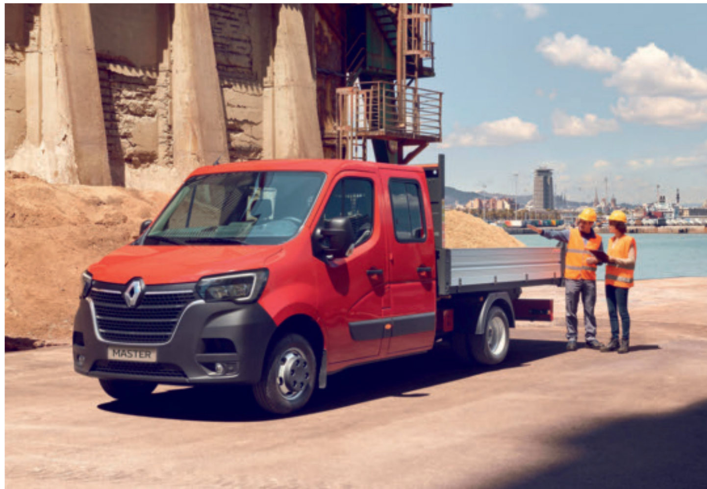
Aperto o chiuso: il modello Renault Master adatto a ogni tipo di trasporto, sempre disponibile con imbattibili offerte Pro+.