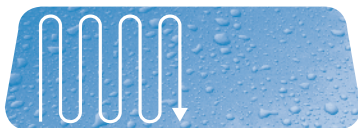
Vertikální aplikace přípravku

Vaše čelní sklo je chráněno po dobu 6 měsíců