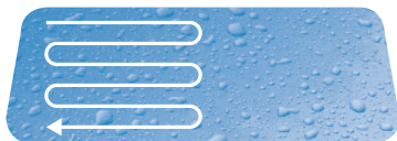
Horizontální aplikace přípravku

Vysušení: Ihned po nanesení přípravku na celý povrch čelního skla utřete sklo čistým suchým hadrem.