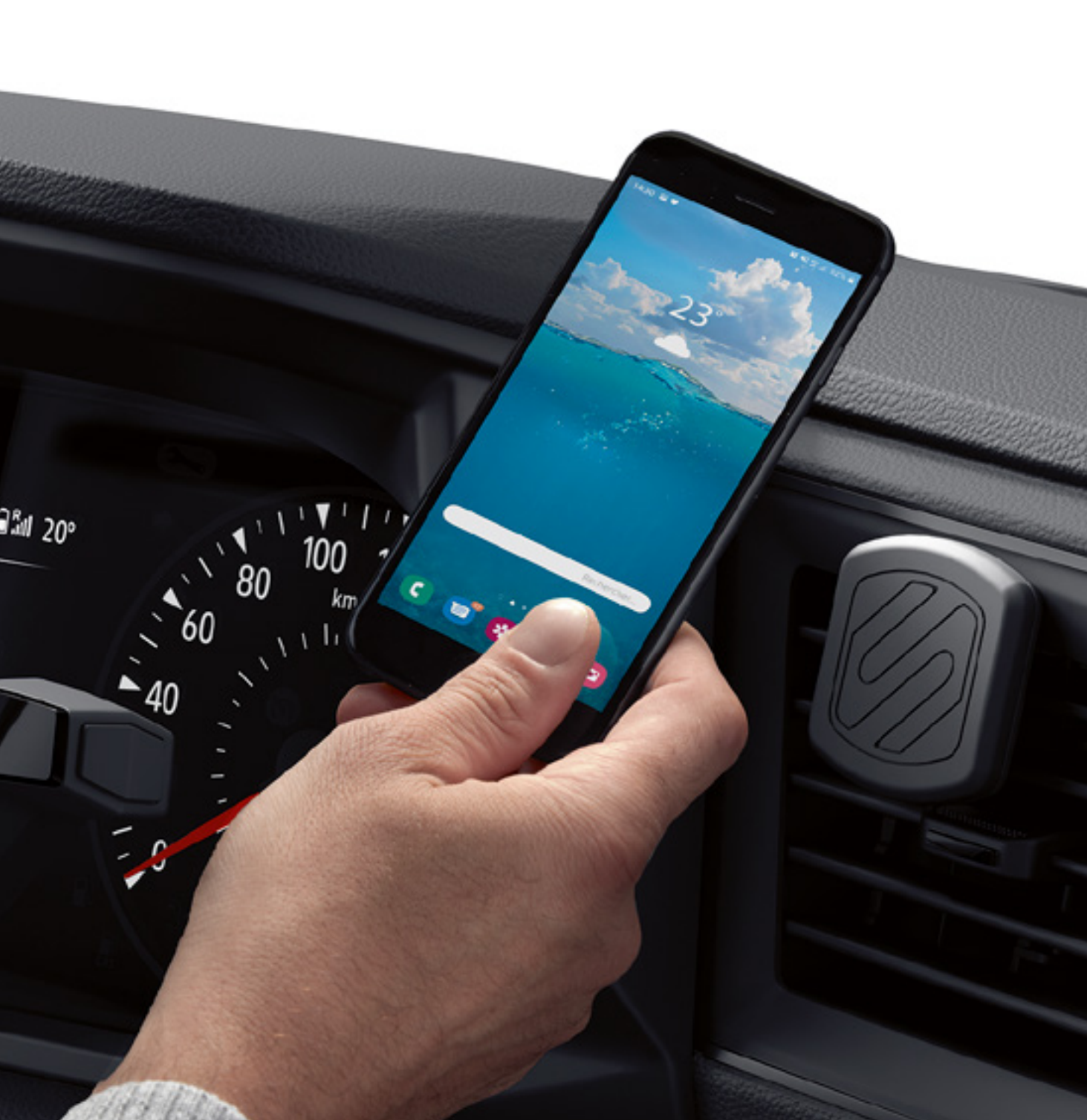
magnetický držák telefonu