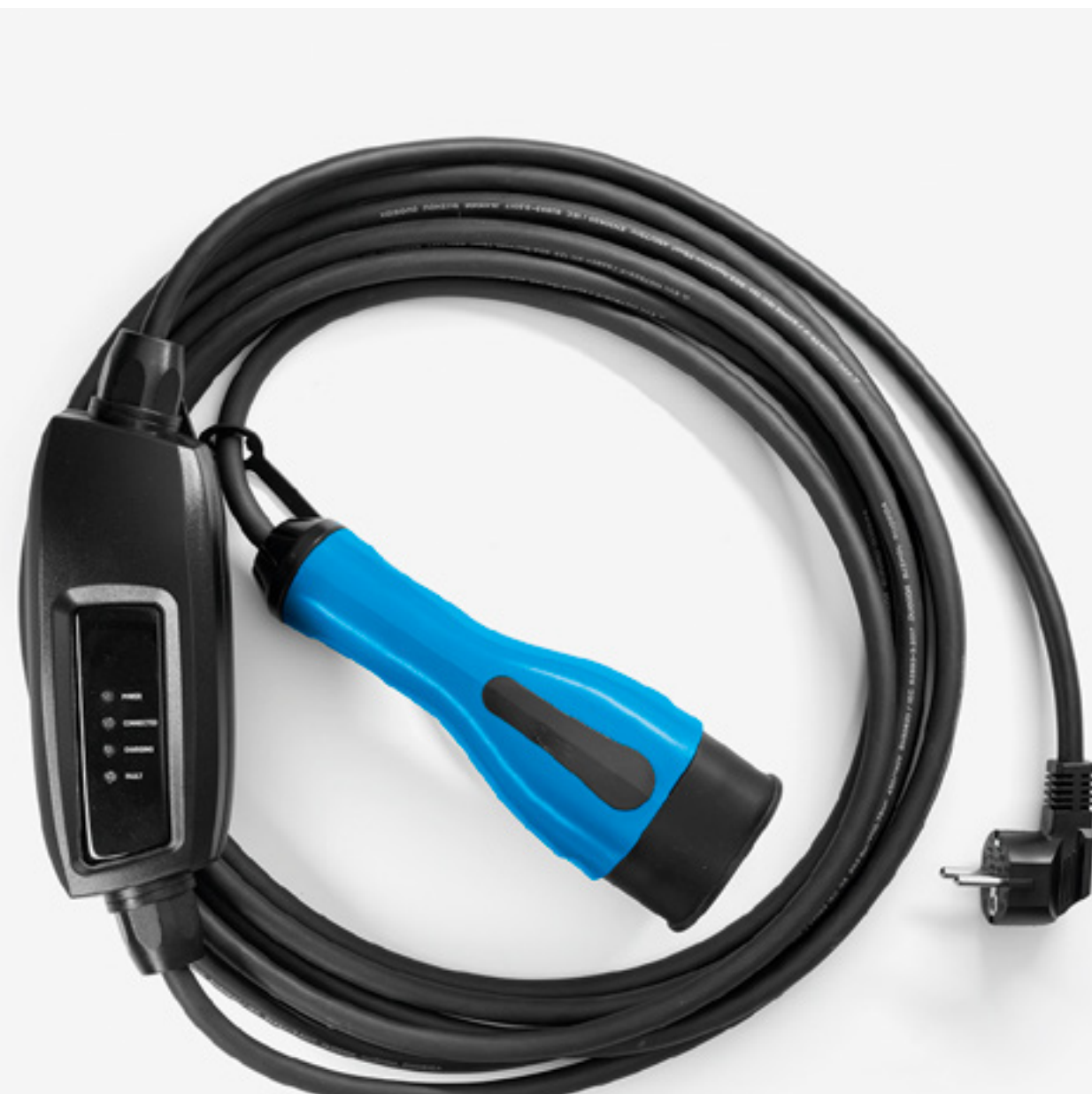
kabel pro domácí nabíjení