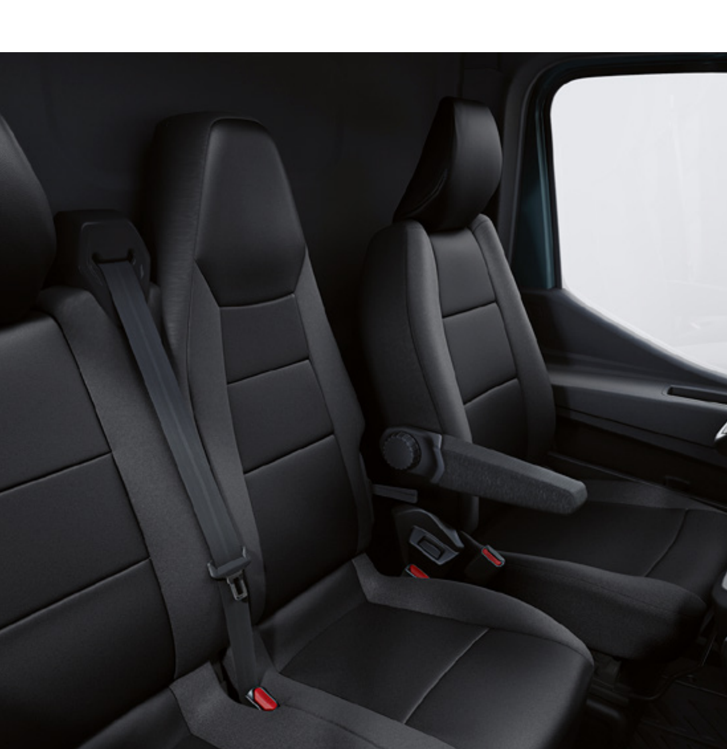
potahy sedadel Super Aquila

Potahy sedadel chrání původní čalounění před opotřebením a nečistotami. Odnímatelný držák chytrého telefonu vám umožní bezpečně používat telefon na cestách. A v neposlední řadě chladič box udržuje jídlo a nápoje ve správné teplotě.