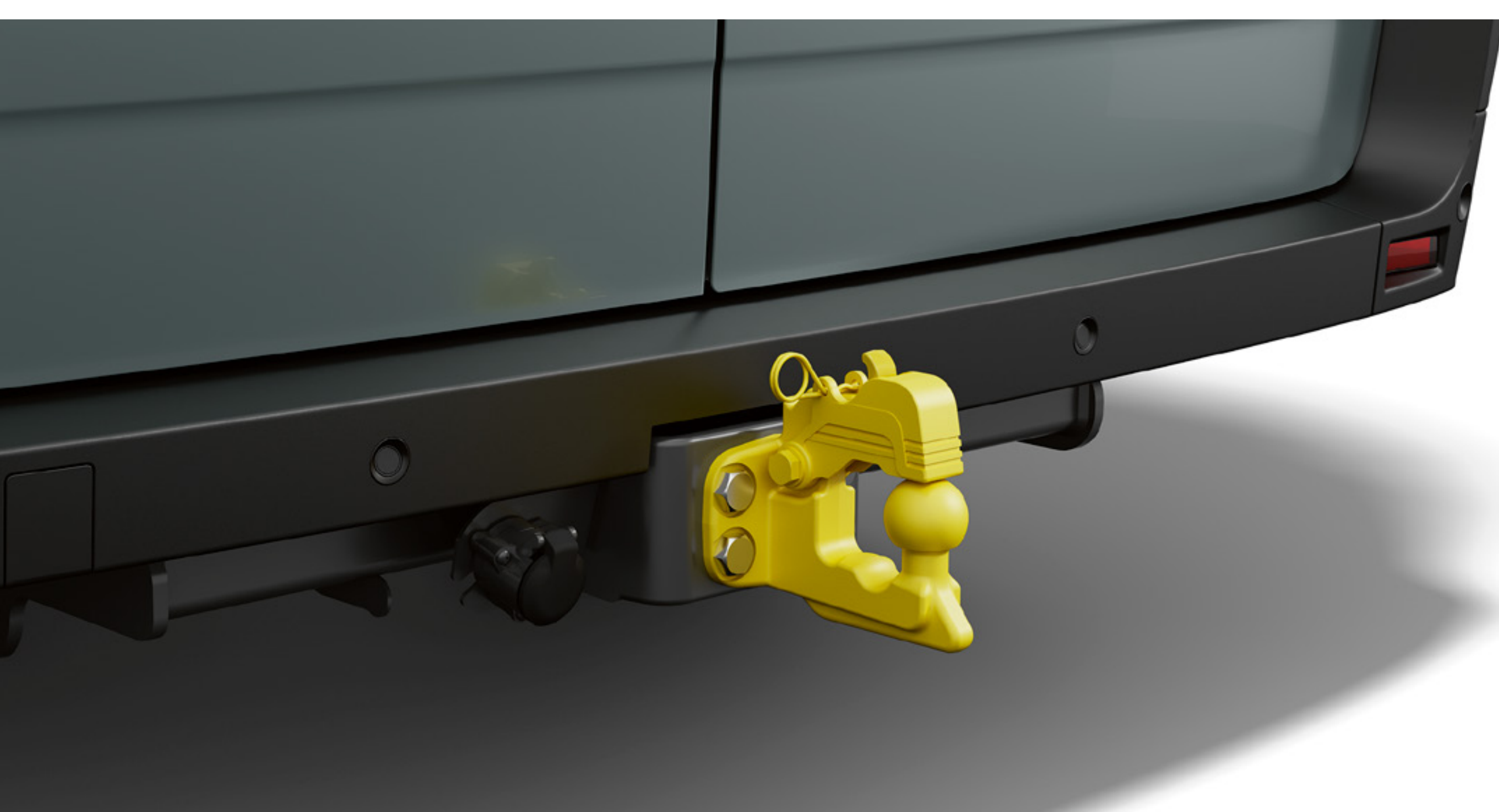
tažné zařízení Standard s fixní spojkou se 4 otvory

Paket tažného zařízení Standard s kulovým kloubem, kulovou fixní spojkou nebo tažným třmenem je praktickým a bezpečným řešením pro tažení všech nákladů.