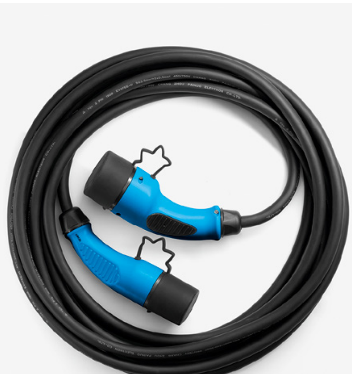
nabíjecí kabel pro wallbox

Využijte kabel Flexicharger pro použití se zesílenou domácí zásuvkou (až 50 km za 3 hodiny a 55 minut) nebo příležitostný domácí kabel pro použití se standardními zásuvkami (až 50 km za 6 hodin a 28 minut). Nabíjecí kabel typu 2 (T2), určený pro dlouhé cesty, lze použít na veřejných i domácích nabíjecích místech.