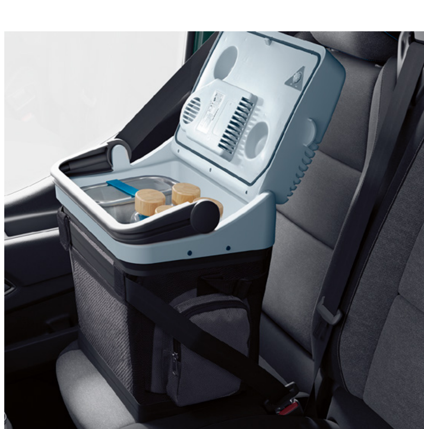
chladič box 24 litrů (42 x 42 x 30 cm)