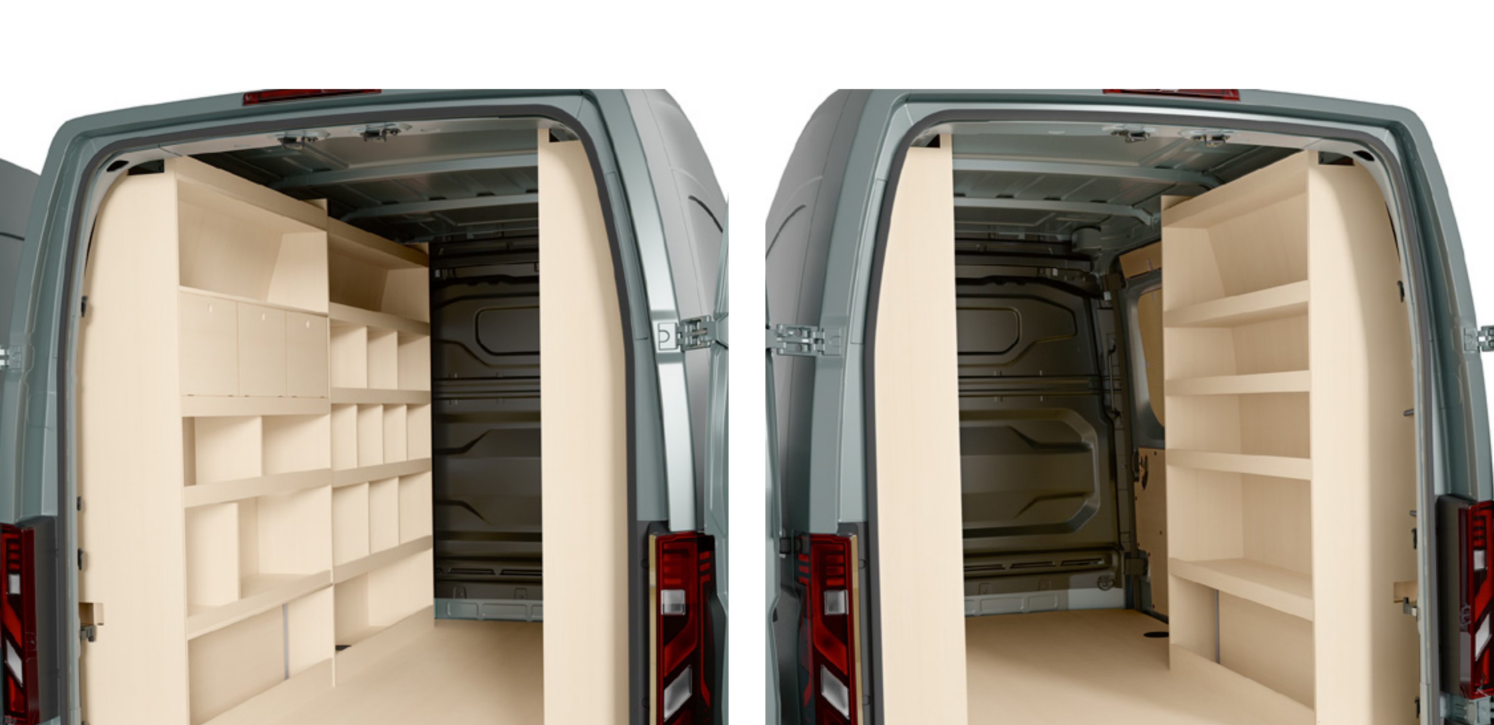
dřevěné regály levé - přední a zadní

Přizpůsobte si nakládací prostor pomocí regálů a otevřených nebo uzavřených skříněk. Tyto prvky jsou praktické a pomáhají udržovat vaše vybavení v pořádku a na dosah.