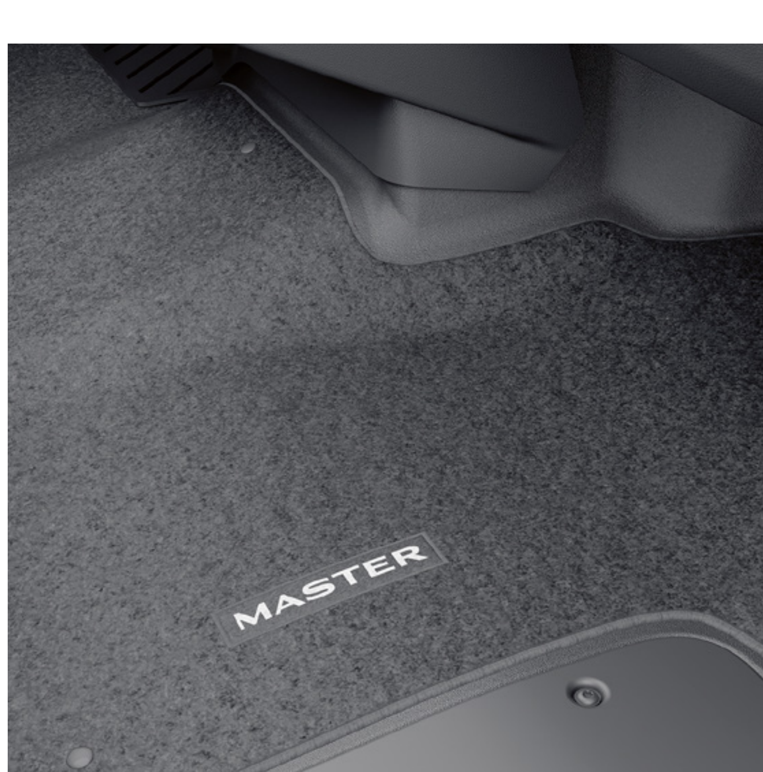
textilní koberec - celá první řada

Potahy sedadel chrání původní čalounění před opotřebením a nečistotami. Odnímatelný držák chytrého telefonu vám umožní bezpečně používat telefon na cestách. A v neposlední řadě chladič box udržuje jídlo a nápoje ve správné teplotě.