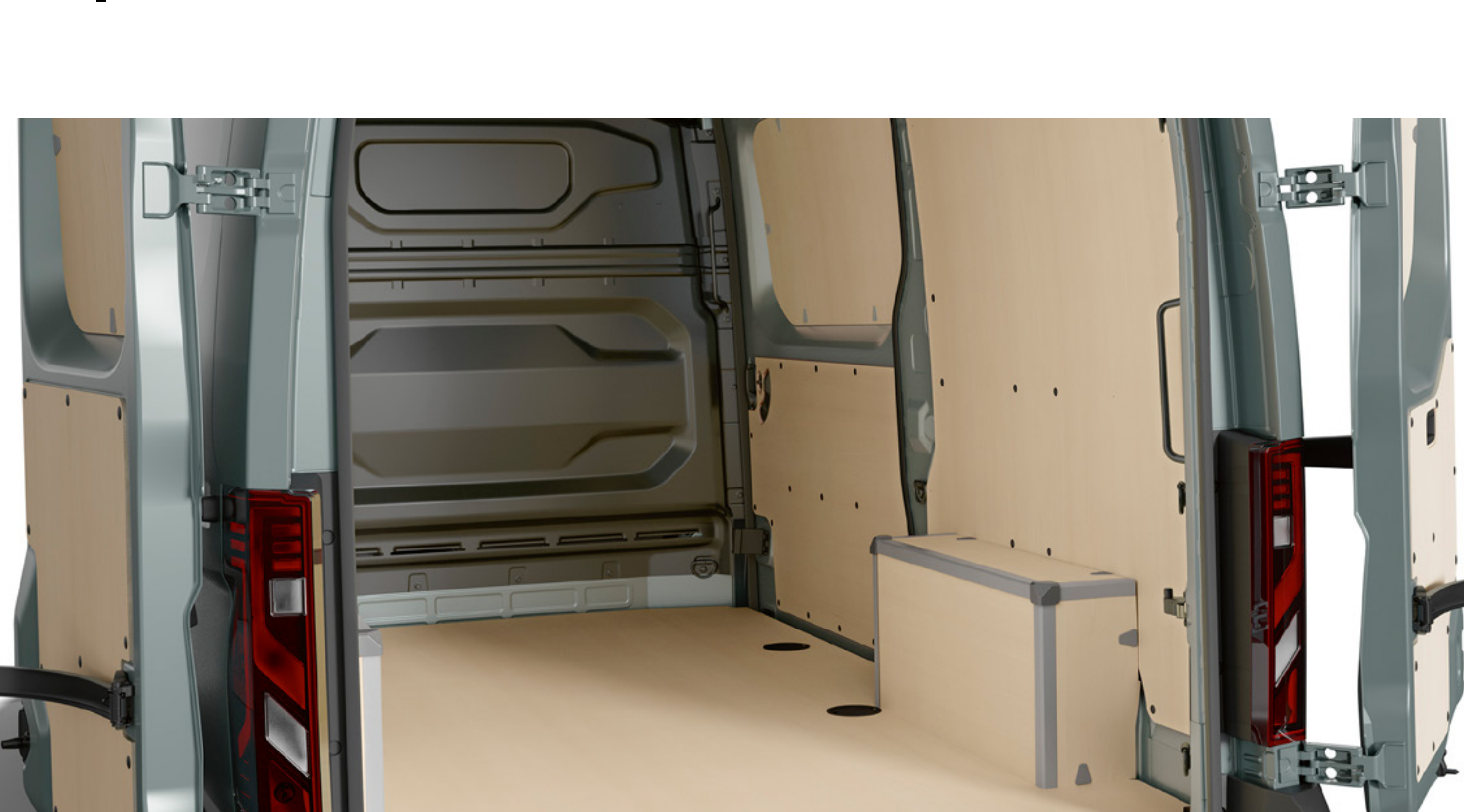
obložení zavazadlového prostoru STANDARD

Obložení zavazadlového prostoru STANDARD: kvalita topolového dřeva zajišťuje zvýšení robustnosti obložení, včetně 12mm dřevěné podlahy. Vhodné zejména pro standardní použití v suchém prostředí.