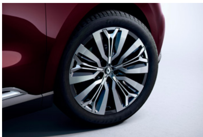
20" disky kol z lehkých slitin, design Initiale Paris