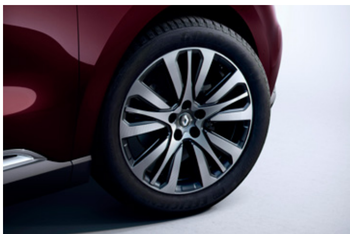
19" disky kol z lehkých slitin, design Initiale Paris