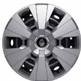
16" ocelové disky kol s okrasnými kryty airna