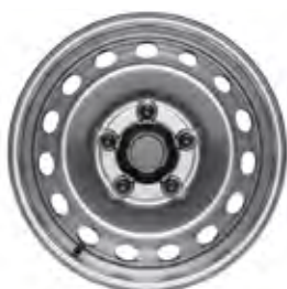
16" ocelové disky kol