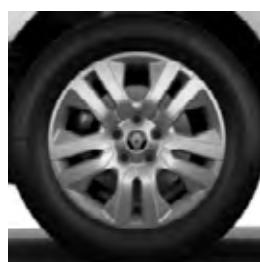
popisek disky kol z lehkých slitin 17"