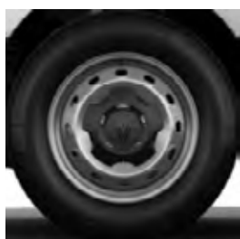
16" ocelové disky kol s okrasnými kryty kol mini