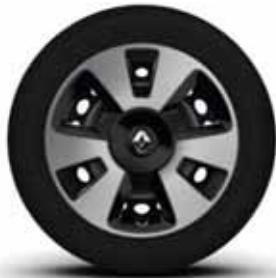
Renault Twingo 40 31 586 03R Vivastella silber / schwarz 15" 93,54 € 1 95,96 € 2