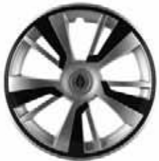
OZUR 14" – 16" silber/schwarz glänzend 77 11 943 933 – 77 11 943 935 ab 73,11 € 1 ab 75,00 € 2