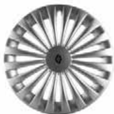
NOKA 14" – 16" silber