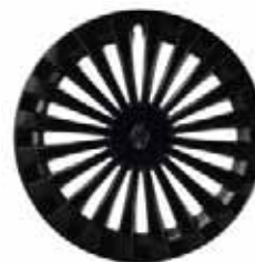
NOKA 14" – 16" schwarz glänzend