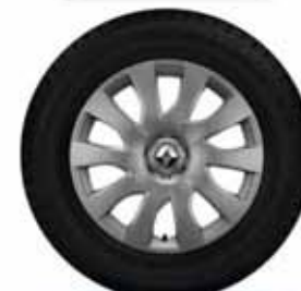
Renault Master 40 31 500 37R Maxi Renault 16" 89,88 € 1 92,20 € 2