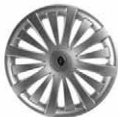
NUTA 14" – 16" silber