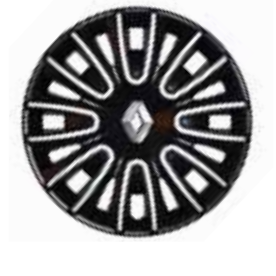
Renault Twingo / Clio 4 82 01 536 033 2-farbige Radzierblende in Schwarz-Grau 95,86 € 1 98,34 € 2