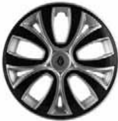
TAGE 14" – 16" silber/schwarz glänzend 77 11 943 927 – 77 11 943 929 ab 73,11 € 1 ab 75,00 € 2