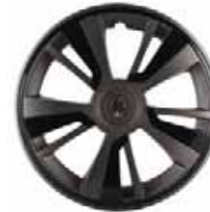
OZUR 14" – 16" anthrazit/Schwarz Glänzend 77 11 943 936 – 77 11 943 938 ab 73,11 € 1 ab 75,00 € 2