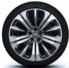
Renault Scénic 40 31 520 77R Life silber/anthrazit 20" 152,05 € 1 155,99 € 2