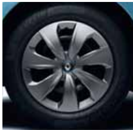
Renault ZOE Eole 15" 3