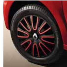
Renault Twingo / Clio 4 82 01 564 416 2-farbige Radzierblende in Schwarz-Rot 95,86 € 1 98,34 € 2