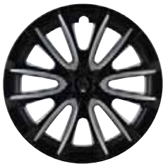
NADI 14" – 16" silber/schwarz glänzend 77 11 943 939 – 77 11 943 941 ab 73,11 € 1 ab 75,00 € 2