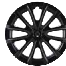
NADI 14" – 16" anthrazit/schwarz glänzend 77 11 943 942 – 77 11 943 944 ab 73,11 € 1 ab 75,00 € 2