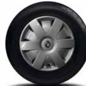
Renault Kangoo 40 31 535 51R Pragma 15" 73,27 € 1 75,16 € 2