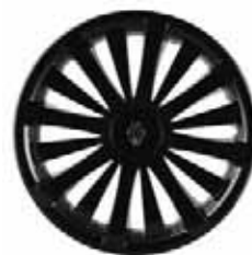
NUTA 14" – 16" schwarz glänzend