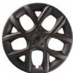
KUPO 14" – 16" anthrazit