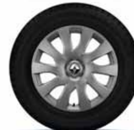
Renault Trafic 40 31 566 50R Maxi Renault 16" 89,88 € 1 92,20 € 2