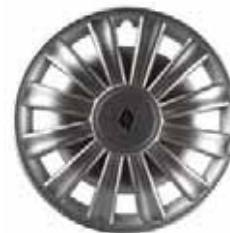
NELA 14" – 16" silber