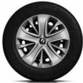
Renault Clio 4 / Grandtour 40 31 572 71R Lagoon 15" 89,88 € 1 92,20 € 2