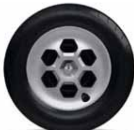
Renault Twizy 40 31 566 46R Snowflake grau 13" 89,88 € 1 92,20 € 2