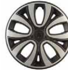
TAGE 14" – 16" grau/anthrazit 77 11 943 930 – 77 11 943 932 ab 73,11 € 1 ab 75,00 € 2