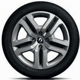
Renault Clio Attract 16" 40 31 588 95R 116,- €