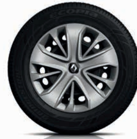
Renault Mégane Lagoon 15" 40 31 572 71R 93,- €