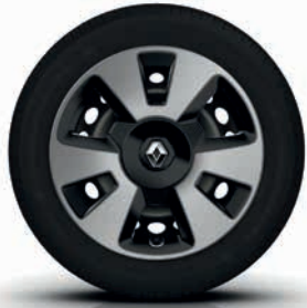
Renault Twingo Vivastella Silber/Schwarz 15" 40 31 586 03R 98,- €