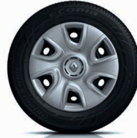
Renault Captur Extreme 16" 40 31 701 56R 98,- €