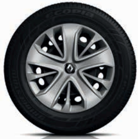
Renault Clio Lagoon 15" 40 31 572 71R 93,- €