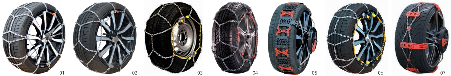
01 Standard, 7 mm 02 Standard, 9 mm 03 Standard, 12 mm 04 Standard, 13 mm 05 Polaire Grip 06 Polaire, 7 mm 07 Polaire Grip Metall