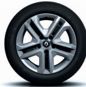
Renault Mégane Complea 16" 40 31 549 60R 90,- €