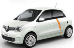
Quarz-Weiß mit Striping „Full Vibes“