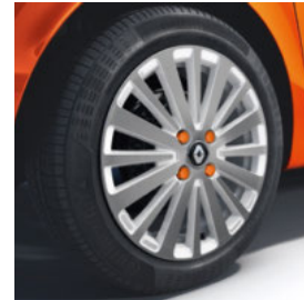
16-Zoll-Leichtmetallrad „Yeti“ mit Designelementen in Weiß und Radschraubenkappen in Orange