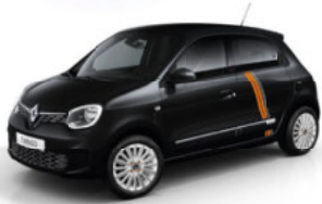
Black-Pearl-Schwarz mit Striping „Full Vibes“