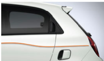
Quarz-Weiß mit Striping „3 Lines Vibes“