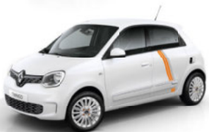
Pyrénées-Weiß mit Striping „Full Vibes“