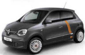
Lunaire-Grau mit Striping „Full Vibes“