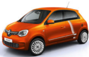
Valencia-Orange mit Striping „Full Vibes“