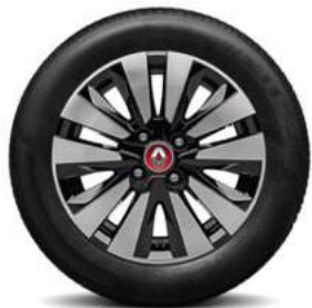
15-Zoll-Leichtmetallrad „Altana“ glanzgedreht in Schwarz mit Radnabenabdeckung in Rot