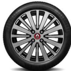
16-Zoll-Leichtmetallrad „Monega“ glanzgedreht in Schwarz mit Radnabenabdeckung in Rot