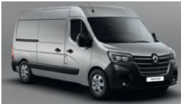
KNH STAR GREY