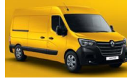
396 CITRON GUL