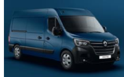
RNQ BLÅ VOLGA