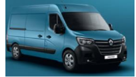
423 BLÅ SAVIEM