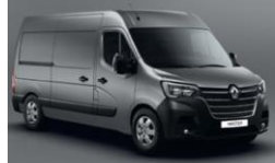
KPW URBAN GRÅ