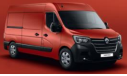
719 RØD MAGMA