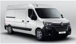
QNG MINERAL HVID