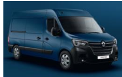
RNQ BLÅ VOLGA