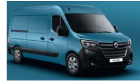
423 BLÅ SAVIEM