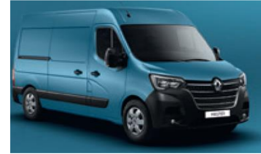
423 BLÅ SAVIEM