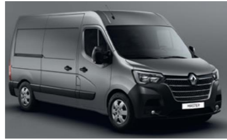
KPW URBAN GRÅ