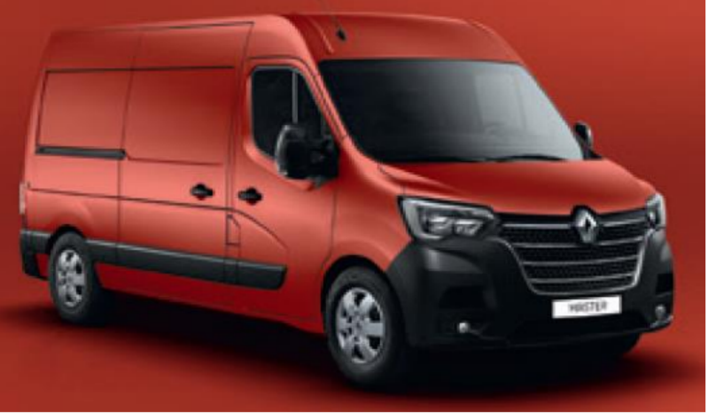
719 RØD MAGMA