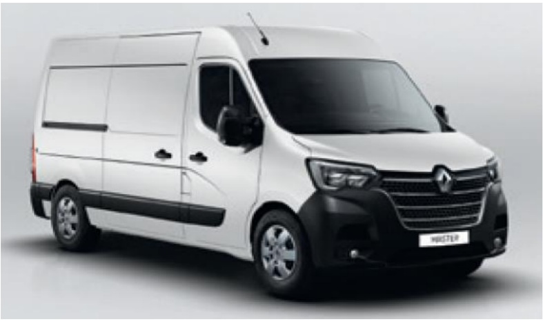
QNG MINERAL HVID