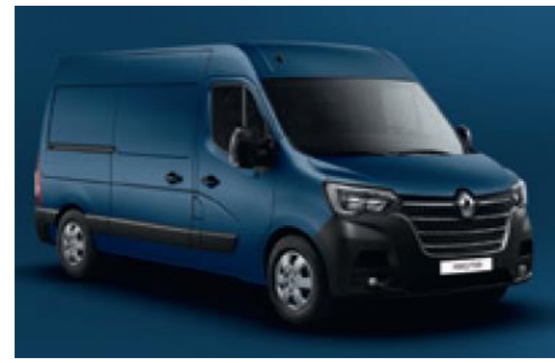
RNQ BLÅ VOLGA