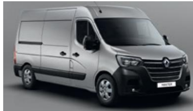
KNH STAR GREY