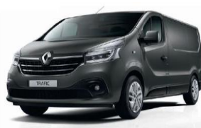
OV KPW URBAN GREY