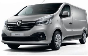
TE D69 PLATINIUM GRÅ