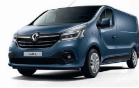
TE J43 PANORAMA BLÅ