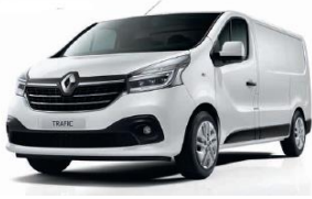
OV 369 GLACIÁRVIT