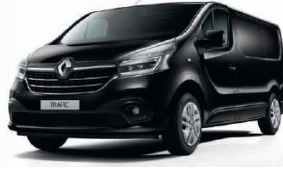
TE D68 SORT