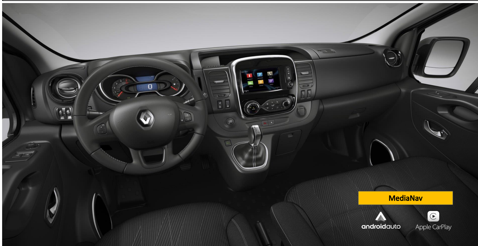
MediaNav navigation 4.0 m. Skandinavien-kort samt radio m. MP3/USB/Bluetooth/AUX/DAB+/Apple CarPlay/Android Auto