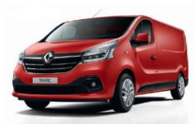
OVNNS/OC70* RØD MAGMA (ej H2)