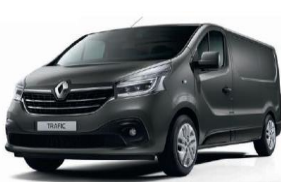
OV KPW URBAN GREY