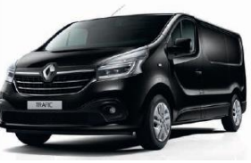
TE D68 SORT