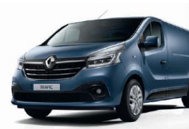
TE J43 PANORAMA BLÅ