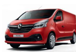
OVNNS/OC70* RØD MAGMA (ej H2)