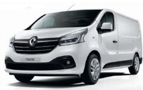
OV 369 GLACIÄRVIT