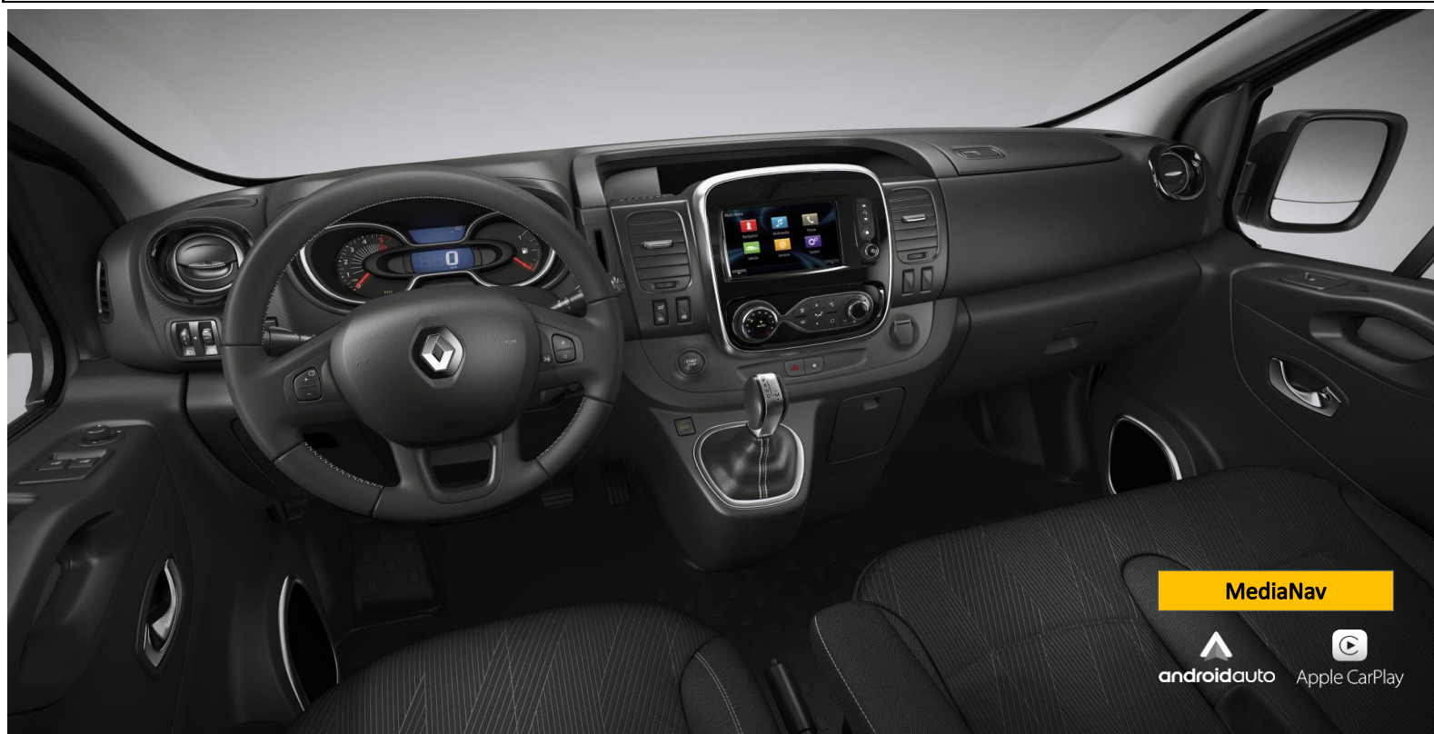
MediaNav navigation 4.0 m. Skandinavien-kort samt radio m. MP3/USB/Bluetooth/AUX/DAB+/Apple CarPlay/Android Auto