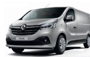
TE D69 PLATINIUM GRÅ