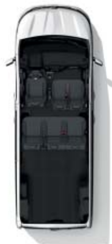
Configuración 6 plazas