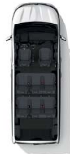
Configuración 8 plazas