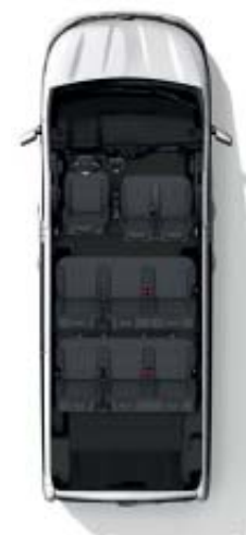
Configuración 9 plazas