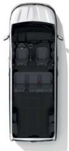
Configuración 5 plazas