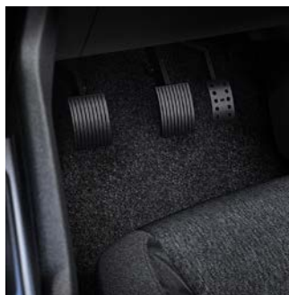
Double pédalier avec accélérateur relevable