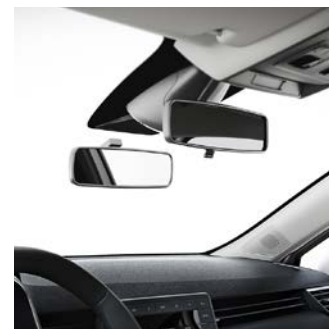
Double rétroviseur intérieur rétractable