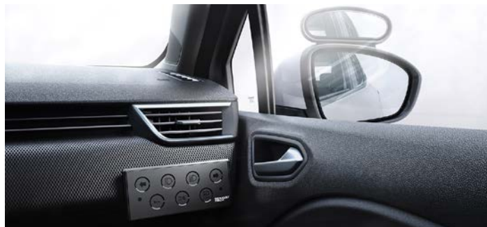
Double rétroviseur extérieur côté moniteur et boîtier de commandes intégré

Utilisant la technologie à câble ou à tringlerie (selon les modèles), notre solution a été testée selon un cahier des charges très strict et se décline en 2 ou 3 pédales, selon la boîte de vitesses du véhicule. La pédale d'accélérateur est relevable ou amovible afin de se conformer à l'utilisation du véhicule lors du passage de l'examen de la conduite.