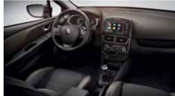
Okviri ventilacijskih otvora i mjenjača u crnoj boji + armaturna ploča i vrata u sivoj boji