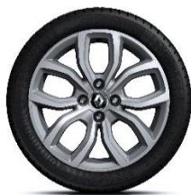
16" aluminijски naplatci Pullsize - Krom