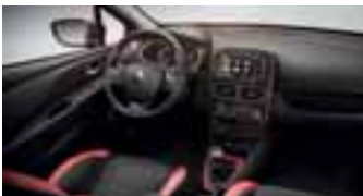
Okvir ventilacijskih otvora i mjenjača u crvenoj boji