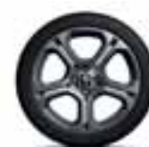
17" GT Line