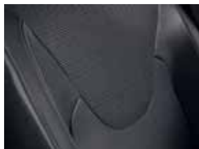
Presvlake u kombinaciji crna/siva