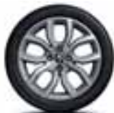
16" Pulsizer - Srebrni