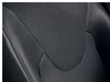
Presvlake u kombinaciji crna/siva