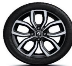
16" aluminijски naplatci Pullsize - Crna