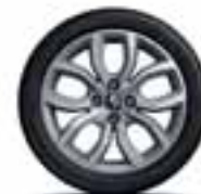
Aluminijski naplatci 16" Pulsiz - srebrni