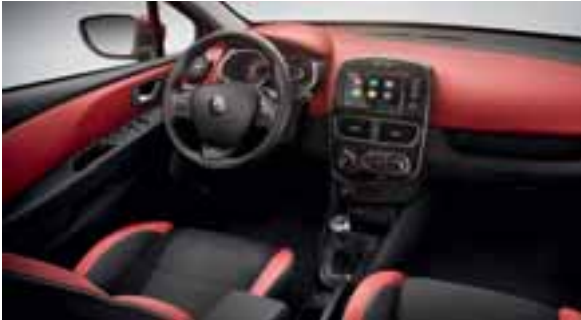
Okvir ventilacijskih otvora i mjenjača u crnoj boji + armaturna ploča i vrata u crvenoj boji