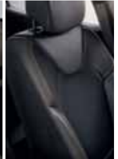
Presvlake u kombinaciji imitacije sive kože - crn baršun