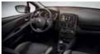
Okvir ventilacijskih otvora i mjenjača u sivoj boji s efektom sjene