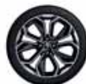
17" Optemic - Kromirani i crni