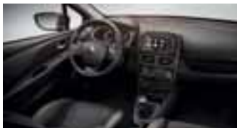
Okvir ventilacijskih otvora i mjenjača u sivoj boji