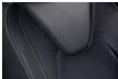
Presvlake u kombinaciji umjetne kože i svijetlosive boje