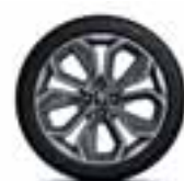
17" Optemic - Kromirani i sivi