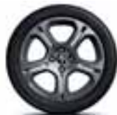
16" GT Line