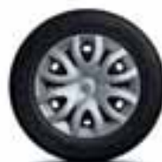
Ukрасni pokrovi kotača 15" Paradise