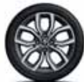
16" Pulsizer - Sivi