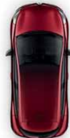
Crna s efektom sjene