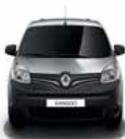
PREDNJI I STRAŽNJI ODBOJNIK I KUĆIŠTA VANJSKIH RETROVI- ZORA MAT CRNE BOJE