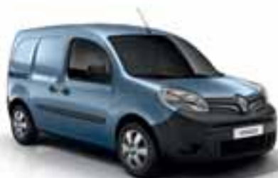
PLAVA ETOILE (MB RNL)