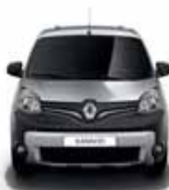
PREDNJI ODBOJNIK STYLE: DVOBOJNI ODBOJNIK MAT CRNE BOJE I U MAT KROMU, DODATNA SVJETLA I CRNA KUĆIŠTA SVJETALA