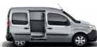
1 ILI 2 OSTAKLJENA BOČNA KLIZNA VRATA*