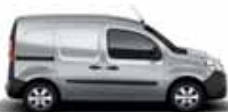
KANGOO EXPRESS & KANGOO Z.E.