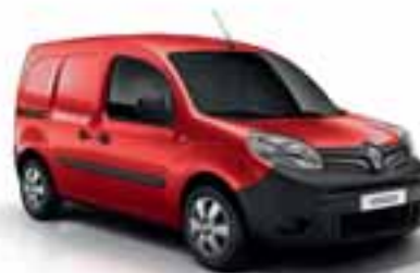
CRVENA VIF (JB 719)