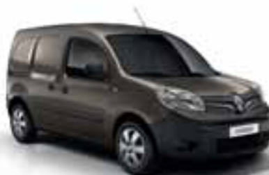
CAPUCCINO SMEĐA (MB CNB)