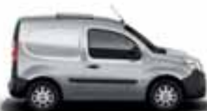
KANGOO EXPRESS COMPACT