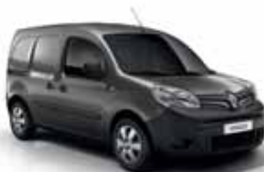
SIVA CASSIOPEE (MB KNG)