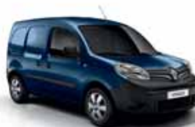
PLAVA COSMOS (MB RPR)*