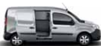
1 ILI 2 NEOSTAKLJENA BOČNA KLIZNA VRATA