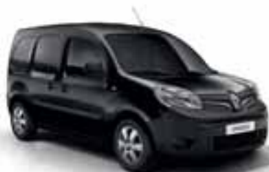
METALIK CRNA (MB GND)