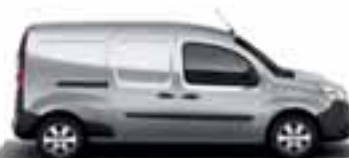
KANGOO EXPRESS MAXI & KANGOO MAXI Z.E.