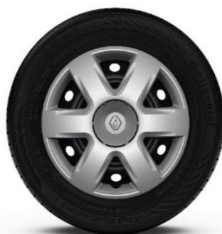
Čelični naplatci 15" s ukrasnim pokrovnima

(1) Moguće samo s paketom PRERADA U OSOBNO VOZILO