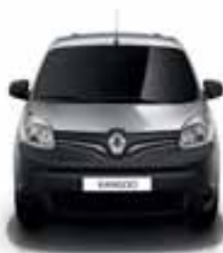
PREDNJI I STRAŽNJI ODBOJNIK I KUĆIŠTA VANJSKIH RETROVI- ZORA MAT CRNE BOJE