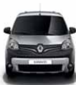
PREDNJI ODBOJNIK STYLE: DVOBOJNI ODBOJNIK MAT CRNE BOJE I U MAT KROMU, DODATNA SVJETLA I CRNA KUĆIŠTA SVJETALA