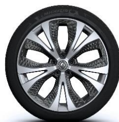
Aluminijski naplatci 20" Exception