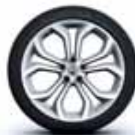
Aluminijski naplatci 20" Silverstone