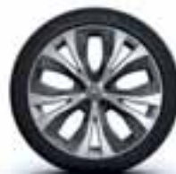
Aluminijski naplatci 20" Exception