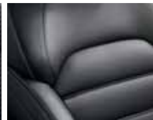
Crne kožne presvlake*