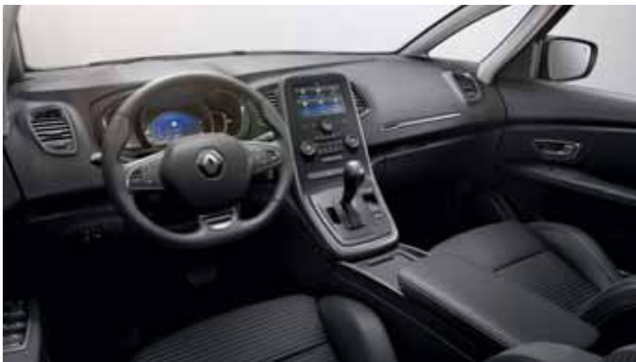
Slika je simbolična.