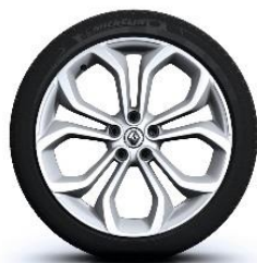
Aluminijski naplatci 20" Silverstone