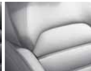
Presvlake od svjetlosive kože*