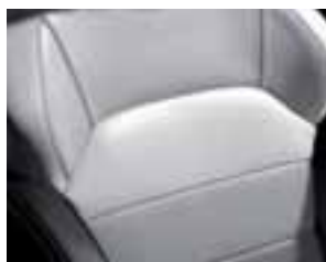
Presvlake od svjetlosive kože (opcija)