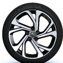
Aluminijski naplatci 20" Quartz