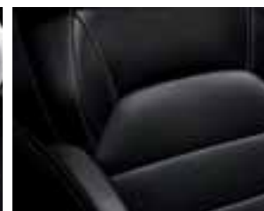
Crne kožne presvlake (opcija)