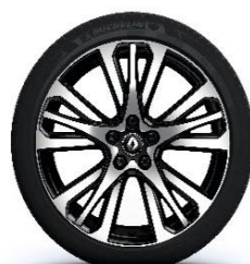
Aluminijski naplatci 20" Initiale