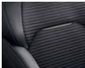
Presvlake od tamnosive tkanine u kombinaciji s imitacijom kože