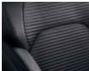
Presvlake od tamnosive tkanine