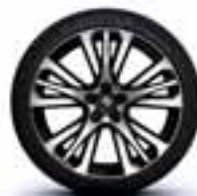
Aluminijski naplatci 20" Initiale Paris