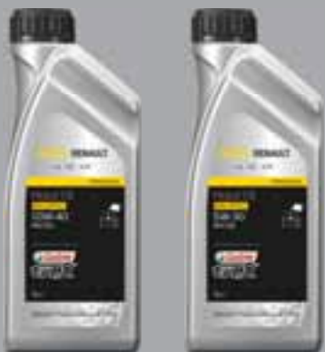
RENAULT - CASTROL GTX RN-SPEC (5W30 & 10W40) - RN0700

Kvalitetno sintetičko ulje za dizelske motore nudi vrhunsku zaštitu u svim uvjetima i produljuje životni vijek motora.