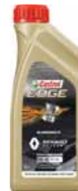
RENAULT - CASTROL EDGE (0W-40) - RN17 RSA

Kvalitetno sintetičko ulje nudi vrhunsku zaštitu motora u svim uvjetima, produljuje životni vijek motora i istodobno smanjuje potrošnju ulja.