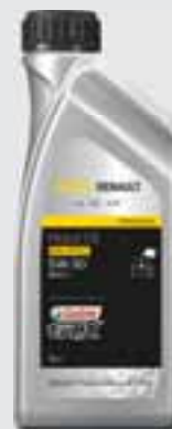
RENAULT - CASTROL GTX RN-SPEC (5W-30) - RN17

Kvalitetno sintetičko ulje nudi vrhunsku zaštitu motora u svim uvjetima i produljuje njegov životni vijek.