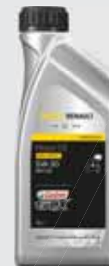
RENAULT - CASTROL GTX RN-SPEC (5W30) - RN0720

Visokokvalitetno sintetičko ulje nudi vrhunsku zaštitu motora, brzo podmazivanje kod pokretanja i tijekom zagrijavanja. Smanjuje potrošnju goriva.