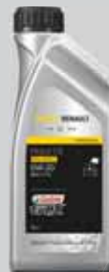
RENAULT - CASTROL GTX RN-SPEC (0W20) - RN17 FE

Visokokvalitetno sintetičko ulje nudi vrhunsku zaštitu motora, brzo podmazivanje kod pokretanja i tijekom zagrijavanja. Smanjuje potrošnju goriva.