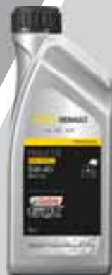
RENAULT - CASTROL GTX RN-SPEC (5W40) - RN0710

Kvalitetno sintetičko ulje nudi vrhunsku zaštitu motora u svim uvjetima.