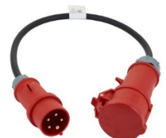
32A - 16A adapter