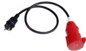
Villásdugó adapter 16 A