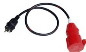
Villásdugó adapter 32 A