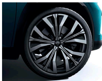
20" könnyűfém EFFIE keréktárcsa