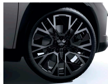
20" könnyűfém ESPRIT ALPINE keréktárcsa