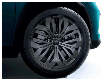
18" könnyűfém DIAMOND keréktárcsa