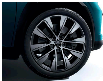
19" könnyűfém KOMAH keréktárcsa