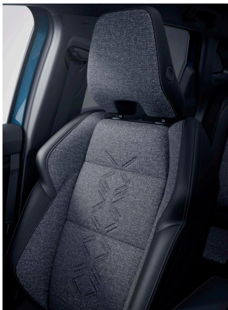
Fekete műbőr- és szürke szövet üléskárpit