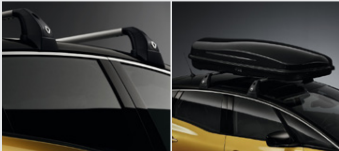
QuickFix tetőrudak (2 db), tetőbox (630 l) 212 990 Ft