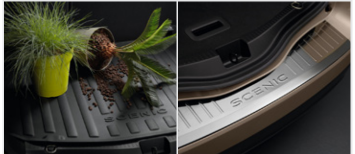
Csomagtér tálca, csomagter küszöbvédő 48 990 Ft

** Az akciós bruttó tartozék-csomag árak tartalmazzák a tartozékok fel- és beszerelésének ajánlott bruttó munkadíját is.