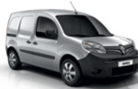
Highland szürke (KQA)*