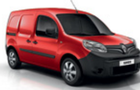
Élénk piros (719)