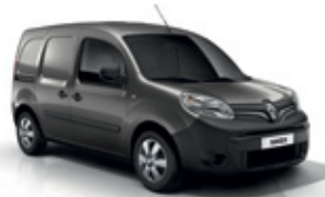
Kassziopeia szürke (KNG)*