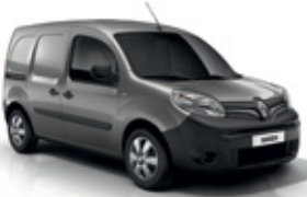
Éjféli szürke (KPW)