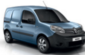
Üstökös kék (RNL)*