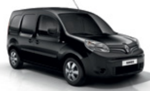
Fekete metál (GND)*