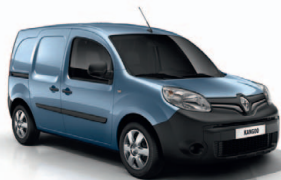
Üstökös kék (RNL)*