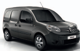
Kassziopeia szürke (KNG)*