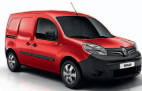
Élénk piros (719)