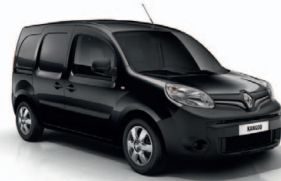
Fekete metál (GND)*