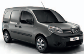
Éjféli szürke (KPW)