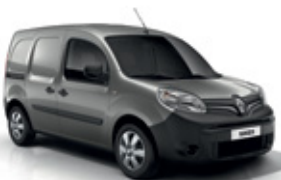
Éjféli szürke (KPW)