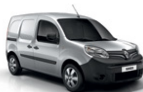
Highland szürke (KQA)*