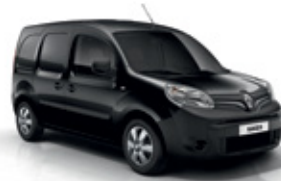
Fekete metál (GND)*