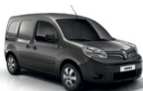
Kassziopeia szürke (KNG)*