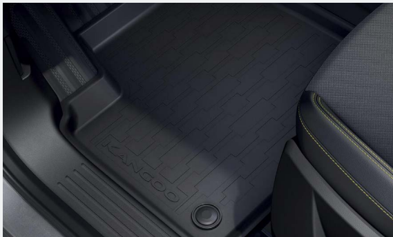
Hattyúnyakas vonóhorog, gumiszőnyeg