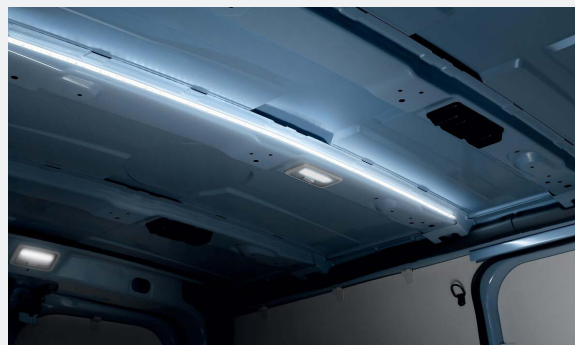
LED csomagtér világítás